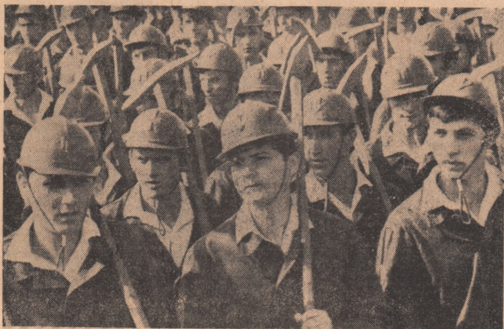
Brigadierii. O ipostază romantică a spiritului nostru de dăruire...