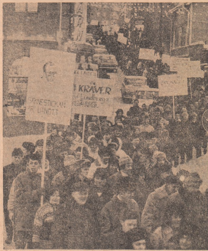
Demonstrație în timpul grevei minerilor de la Kiruna (Suedia)