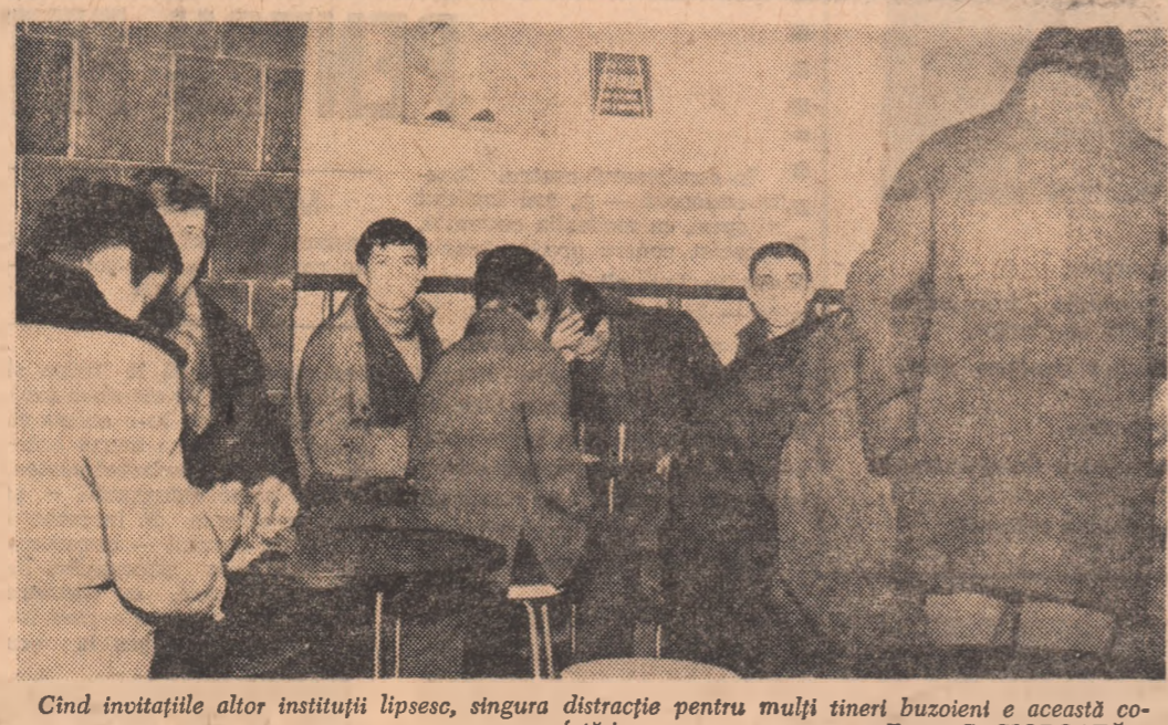
Cînd invitațiile altor instituții lipsesc, singura distracție pentru mulți tineri buzoieni e această cotetărie

loace pentru diversificarea amplă a activităților în toate sectoarele casei. În planificarea casei de cultură de la Iași am întîlnit cicluri de probleme cu caracter generalizator: „Congresul al X-lea al P.C.R.”, focar de năzuințe și împliniri ale idealurilor populare”, „Tinerete și idealuri contemporane”, „Tribuna opiniilor personale” etc.