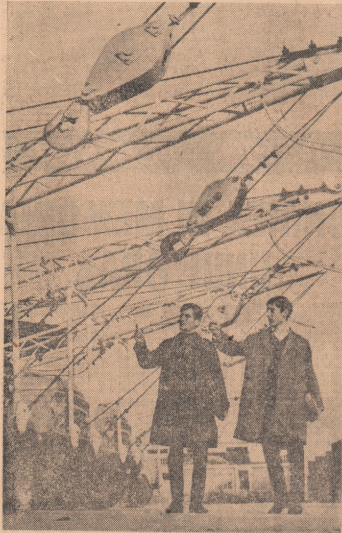
Instalații înainte de a porni spre unitățile petroliere.

CĂLIN STĂNCULESCU (Continuare în pag. a IV-a)