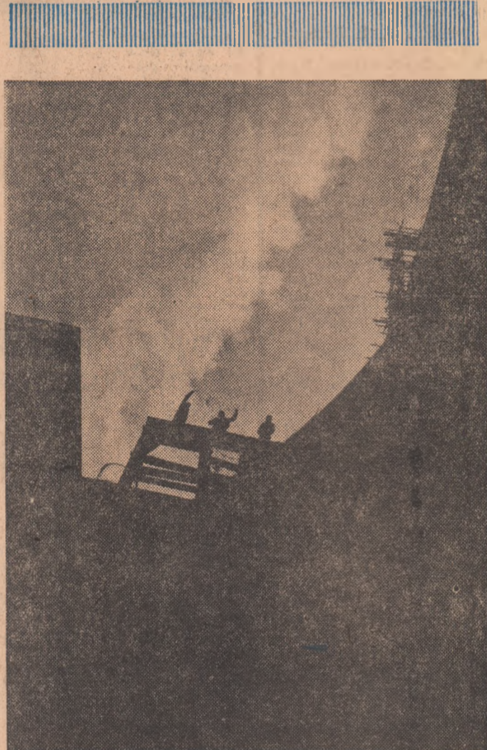
Decupaje la orizont.

ale societății, cu planurile pe care le are în perspectivă țara, ne obligă la atenție, la meditație, și nu numai la alt: la măsuri. Între acestea, munca de educație, la care ziarul își propune să-și aducă aportul, și se străduiește s-o facă. Cu sprijinul colaboratorilor, al cetățenilor, al tinerilor înșiși, majoritatea întrebărilor își găsesc răspunsul necesar.