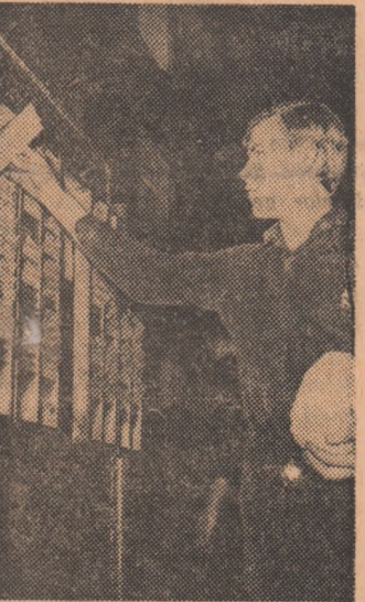
Unul din sutele de tineri care încep punctual programul de lucru.