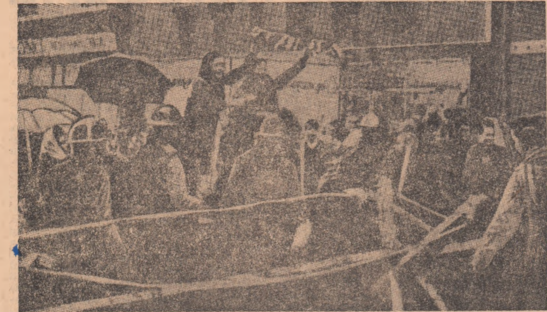
Aspect de la recentele incendiate de la Londonderry (Irlanda de nord).

● RĂSPUNZIND UNEI ÎNTREBĂRI referitoare la evoluția situației din zona mediteraneană, ministrul algerian al informațiilor, Mohammed Ben Yahia, a declarat în cadrul unei conferințe de presă că Algeria „consideră că Mediterana trebuie