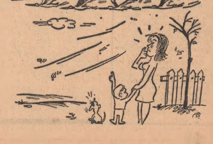
Mămică, do' iarna cine a duce copiii? Desen de PETRU GAVRILIU