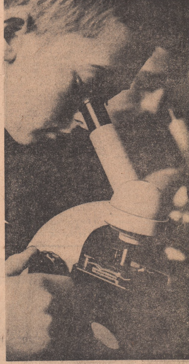
Oră de-laborator