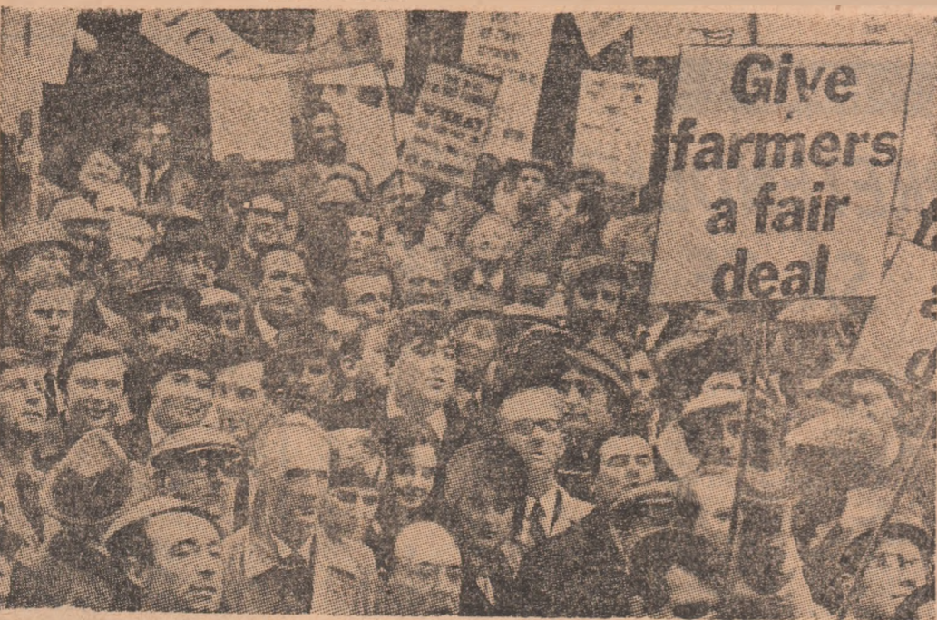
In diferite orase ale Angliei, au loc noi demonstrații ale fermierilor britanici, care cer sporirea subvențiilor guvernului pentru nevoile agriculturii. In imagine, aspect de la o recentă demonstrație desfășurată în fața ministerului agriculturii din Londra