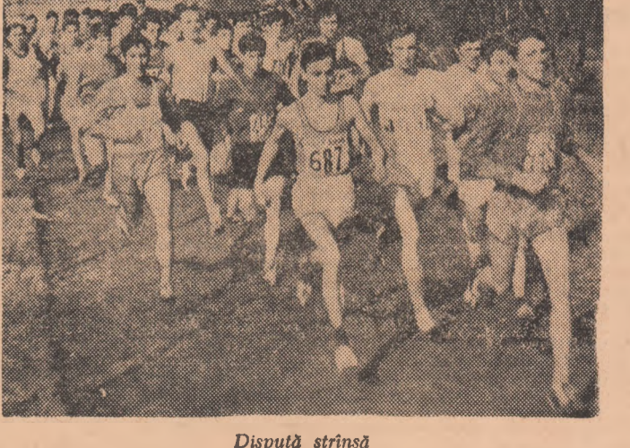
Dispută strînsă

Atletismul trăiește, în primul rînd, prin cifre, din consemnarea rece și implacabilă a performanțelor în foile de concurs. Dincolo de aceste cifre rigurose exacte, imprimante într-o simetrie soavă, rămîn adesea necunoscutele momente dramatice, trăite cu intensitate de atleți și spectatori. Aceste momente au abundat cu prilejul și la Campionatele de sală ale atleților seniori desfășurate sîmbătă și duminică la Complexul sportiv „23 August”.