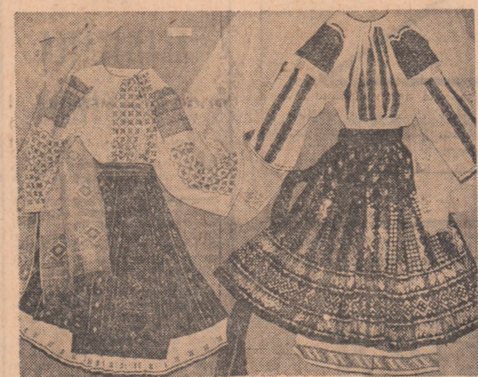
Din frumusețea portului popular

O inițiativă salutară și extrem de utilă tuturor candidaților la studenție s-a concretizat în pagina „Preuniversitaria”, publicată în ultimul număr al revistei „Viața studentescă”. Inaugurînd o serie de fișe de specialitate, pagina dedicată elevilor cuprinde un amplu grup de date referitoare la examenele susținute în sesiunea iulie 1969 la facultățile de fizică, cu durata studiilor de patru sau cinci ani, de la Universitatea din București, Universitatea „Babeș-Bolyai”-Cluj, Universitatea „Al. I. Cuza”-Iași și Universitatea din Timișoara. De un real sprijin pentru orientarea candidaților în învățămîntul superior, asemenea fișe vor fi publicate periodic, ele urmînd să fie în viitor îmbogățite cu informații despre posibilitățile viitorilor specialiști după absolvirea secției sau facultății prezentate.