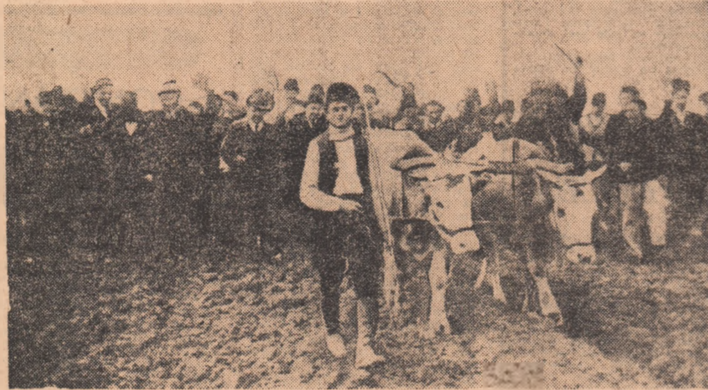
Reforma agrară! Unul din obiectivele de prim plan ale guvernului democratic pentru instaurarea căruia au luptat, cu 25 de ani în urmă, masele populare din țara noastră. În fotografie: imaginea-document a uneia din primele brazde trase de țărani, pe pământul boieresc, în primăvara istorică a lui 1945