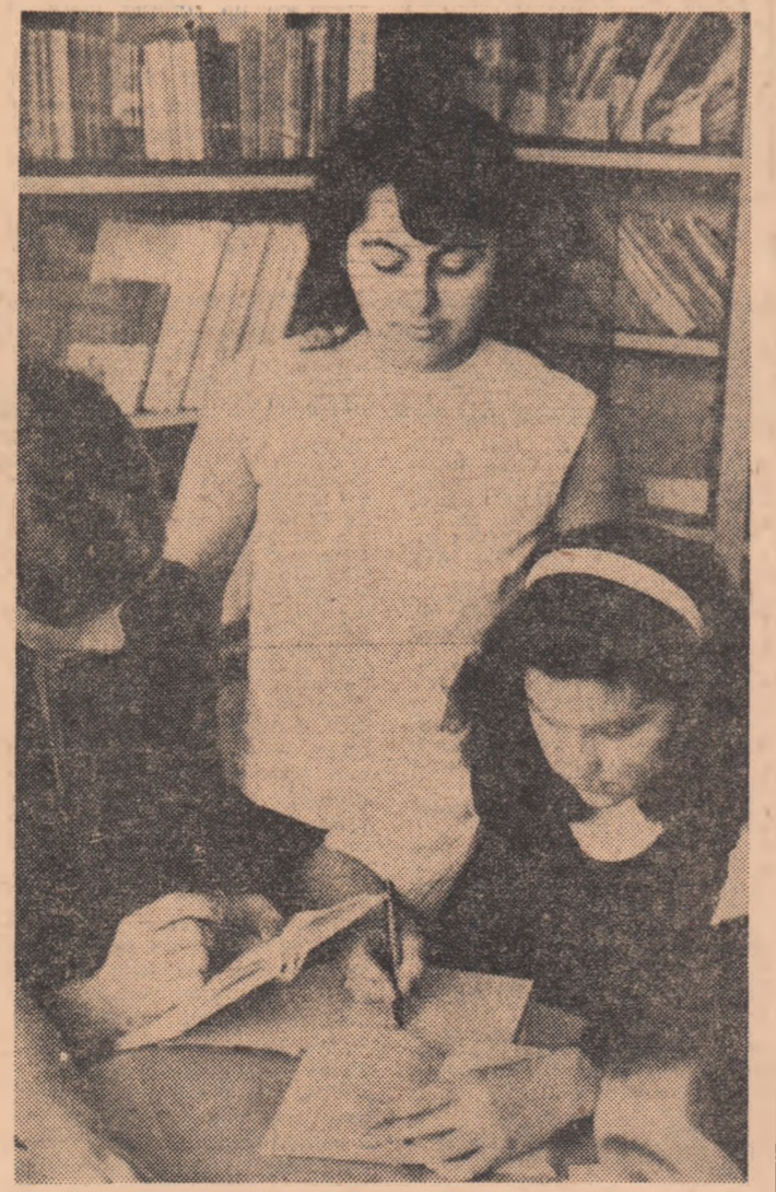
Studiul individual se dezvoltă și la biblioteca liceului. O tîmagine din biblioteca Liceului nr. 40 din București