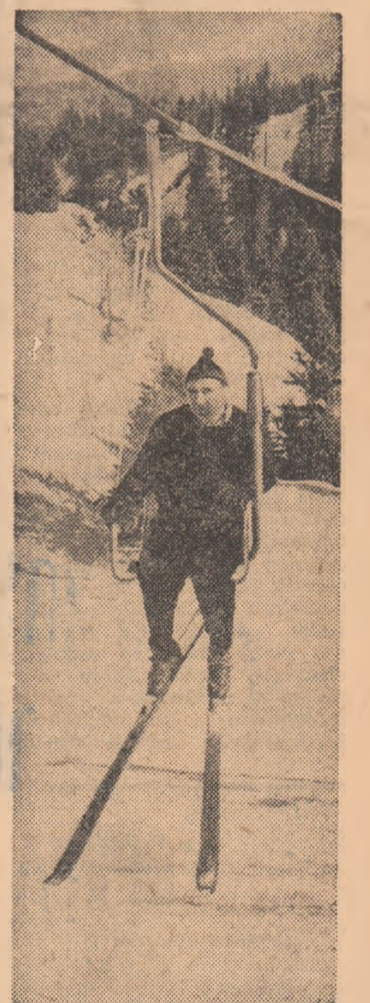
Spre Virful cu Dor.