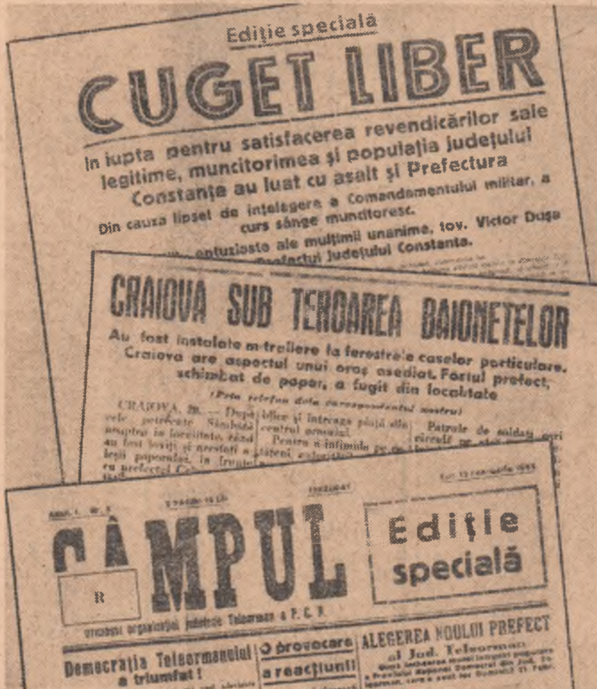
Asaltul prefecturilor! Documentele ore mii de tone, prin stilul alert, prin conținutul adesea dramatic, caracterul unor documente de front. Un front în a cărui primă linie s-a aflat, în permanență, partidul clasei muncitoare