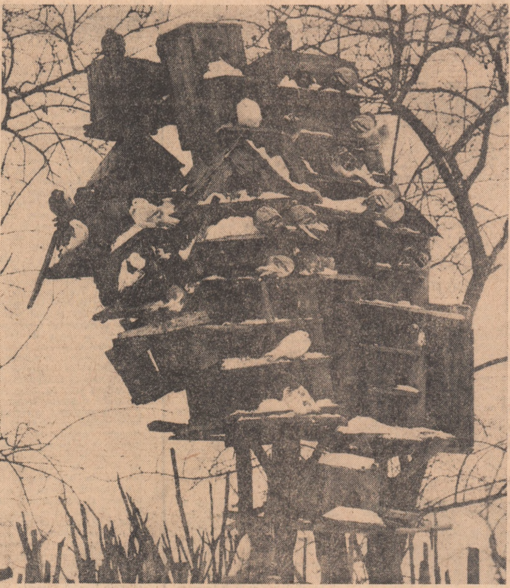
Locatarii „blocului turn” din satul Clătești, județul Ilfov, așteaptă desprimăvărarea.

DOREL DORIAN (Continuare in pag. a IV-a)