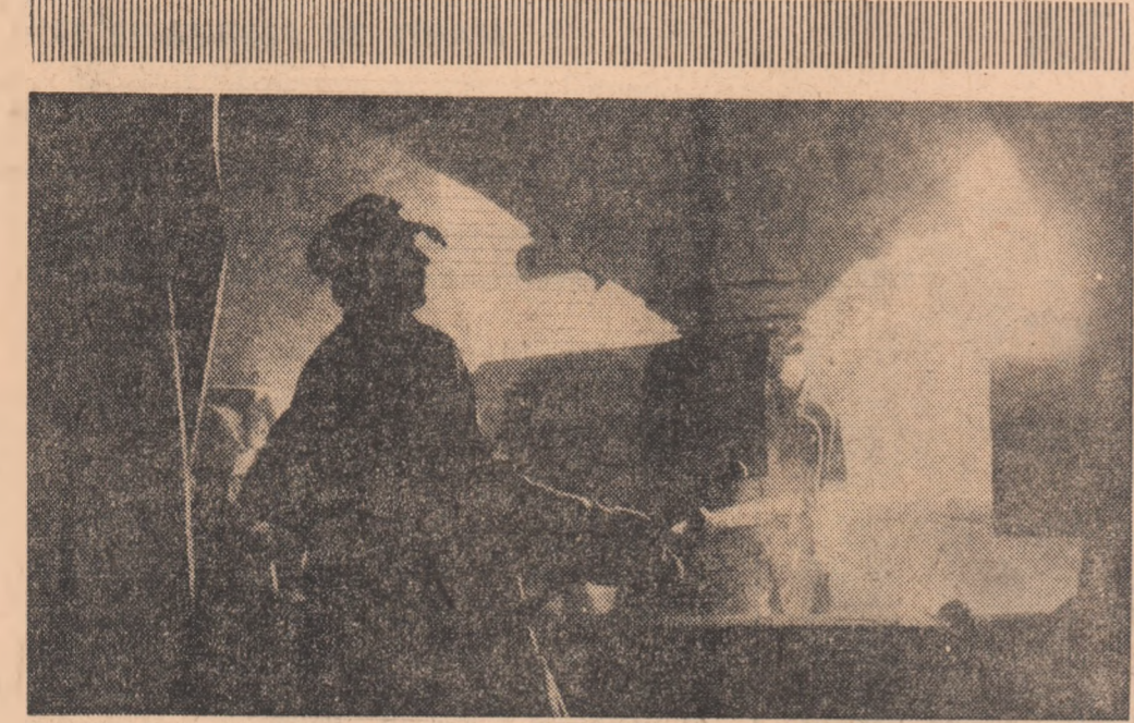
In timpul operatiilor de injectare a dolomitei, pe platforma O.S.M. II de la Hunedoara

ANUL XXVI, SERIA II Nr 6461 6 PAGINI — 30 BANI MARTI 24 FEBRUARIE 1970