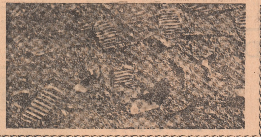
Urmelile pașilor omului pe Lună. Ele vor rămîne nealterate timp de 20.000 de ani, ca o mărturie a vizitei unor ființe inteligente prin aceste locuri. A fost vizitat Pământul acum 15-20.000 de ani, după cum se presupune, de cosmonauții din alte sisteme planetare? Urmelile pașilor lor dacă au fost — s-au șters... O serie de enigme arheologice și legendele biblice pun însă în incertătură oamenii de știință și alimentează fantezia scriitorilor.