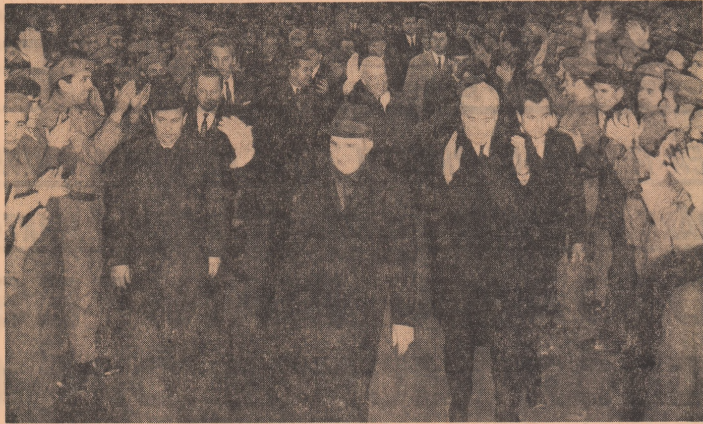
Conducătorii de partid și de stat sînt întîmpinați cu aclamații