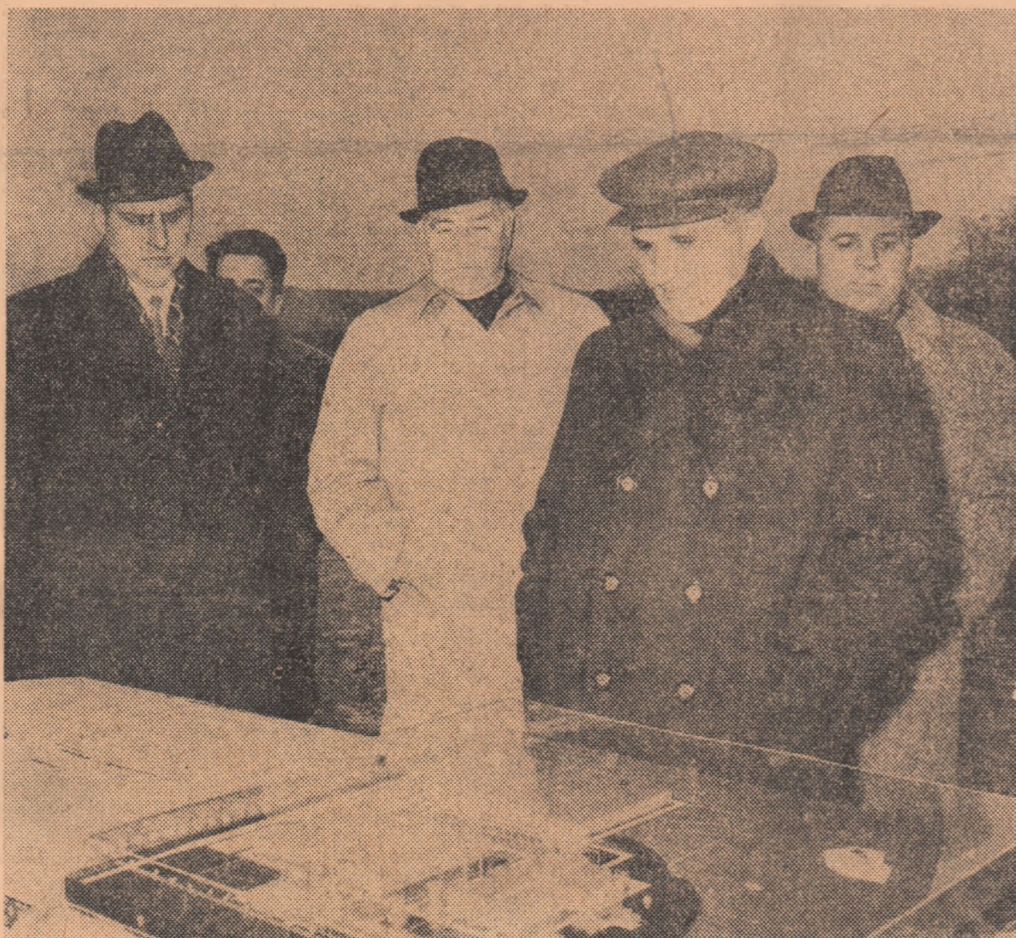
În fața machetei viitoare Uzine de utilaj chimic din Vâlcea.

de materii prime (sare, calcar etc.), cooperarea fructuoasă între unitățile industriale din zona aceasta. Dacă adăugăm că pe teritoriul județului se construiește puternica hidrocentrală de pe Lotru, că exploatarea forestieră și industrializarea lemnelui s-au extins în ultimul timp, că ramuri tradiționale ale agriculturii ca pomicultura, viticultura, zootehnia au cunoscut la rîndul lor o dezvoltare însemnată — vom avea imaginea unui județ în plin progres economic, propulsat impetuos pe calea înfloririi, a creșterii bunăstării materiale și spirituale a locuitorilor săi.