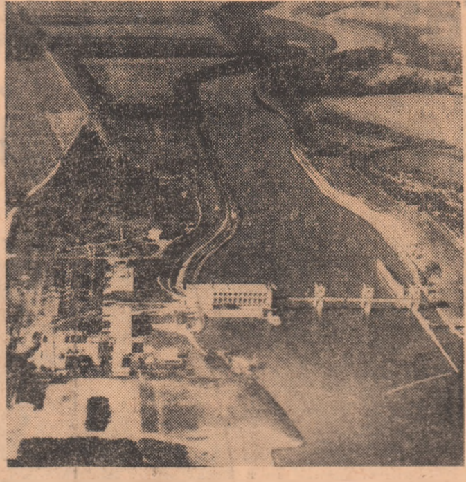
R.P. UNGARA. Vedere a stâvilorului Tiszalök de pe Tisa.

Intreaga presă irakiană a salutat acest important eveniment. Astfel, ziarul „Al Saoura” subliniază „transformarea istorică pe care acest eveniment o aduce în Irak”, arătând că „hotărârea Consiliului de Comandamentului Revoluției de a rezolva pe cale pașni-