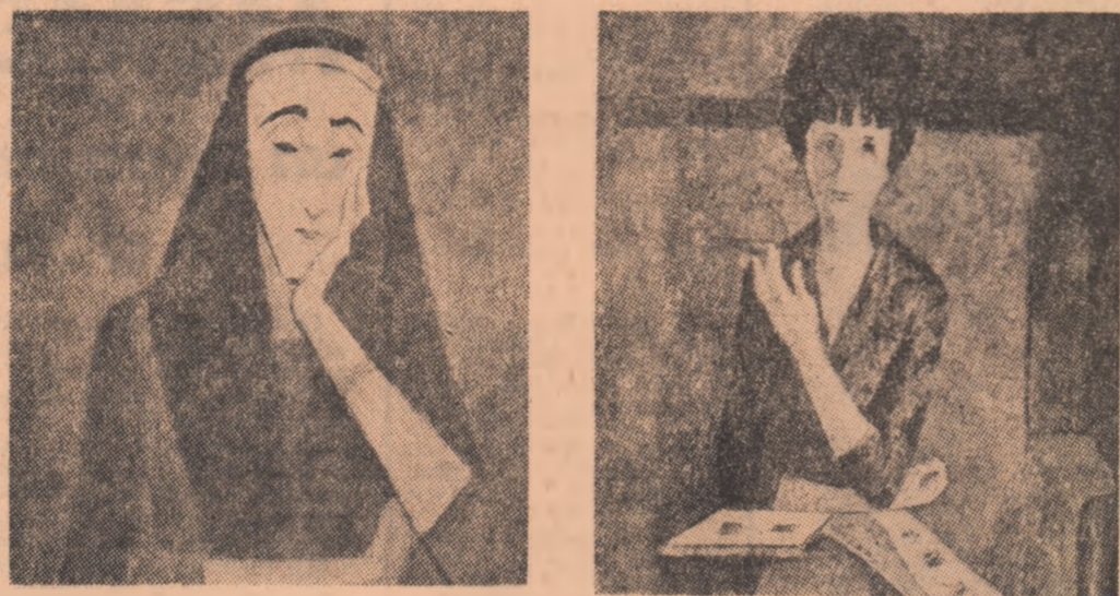
Doi „Portrete” de O. ANGHELUȚĂ