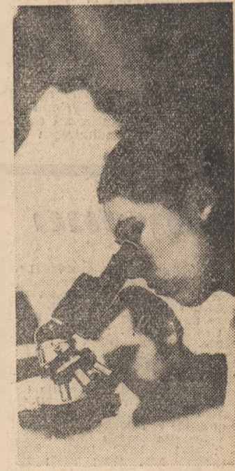
Oră de laborator.

re, secțiile de subinginerii din cadrul Institutului de învățămînt superior nu beneficiază încă, atît din partea forurilor de învățămînt cit și din partea studenților, de atenția cuvenită. Astfel de atitudini au influențat în mod nefavorabil rezultatele sesiunii de examen din februarie. Facultățile Institutului politehnic din Capitală oferă, în acest sens, exemple concludente. Poli-tehnica bucureștenă cuprinde în secțiile de subinginerii (la cursurile de zi) 654 de studenți; numai 409 însă au promovat toate examenele, dintre care 140 cu calificative de 5 și 6. Mai este de menționat că 142 de studenți sînt restanțieri la o disciplină, iar 95, la două sau mai multe discipline. Primul aspect la care ne referim, pentru a explica rezultatele nesatisfăcătoare la examenul din februarie, este atitudinea studen-