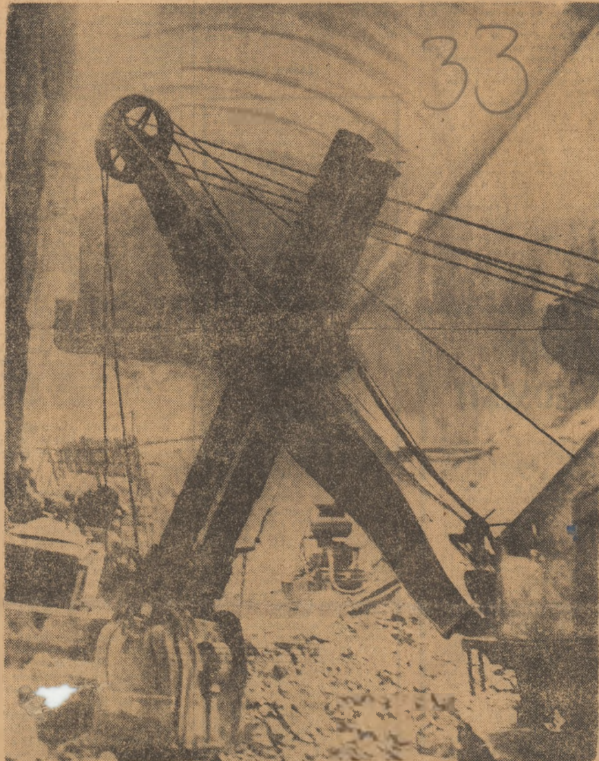
Imagine înfățișînd un front de lucru în centrala subterană de la Cîjunet — Lotru 1970