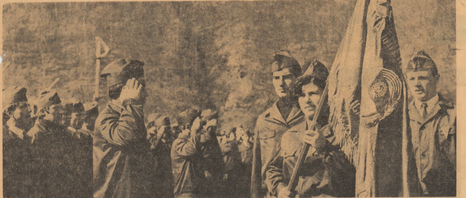
Moment solemn: Drapelul organizației este adus cu toate onorurile la locul adunării festive în care s-a constituit Șantierul național al tineretului de la Lotru.

a fost adusă la cunoștința tinerilor intenția comitetului U.T.C. și prevederile regulamentului de