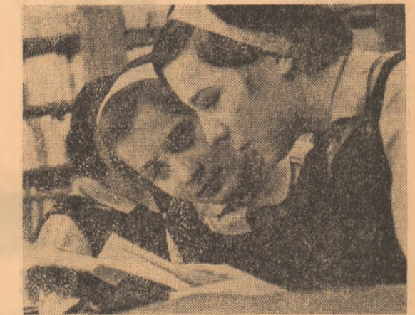
Atmosfera obișnuită în biblioteca Liceului „Gh. Lazăr” din Sibiu

Clubul de la Școala profesională a U.C.M.R. Este destul de mare, înzestrat cu mese de ping-pong, șah, table, dar ce folos, dacă de foarte multe ori se dă o altă destinație. Ultima oară a fost folosit drept expoziție de păsări împăiate sau mai bine-zis, drept magazie, dacă se are în vedere timpul cît au zăcut expo-