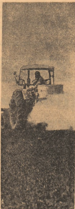
La întreprinderea agricolă de stat Topraisar, județul Constanța, se administrează îngrășăminte chimice pe cultura grîului.

Între întreprindere modernă, în care un colectiv de 2.000 de oameni lucrează cu pasiune, perseverență, prin efort zilnic, pentru construirea unor utilități de înaltă tehniciate, într-o în-