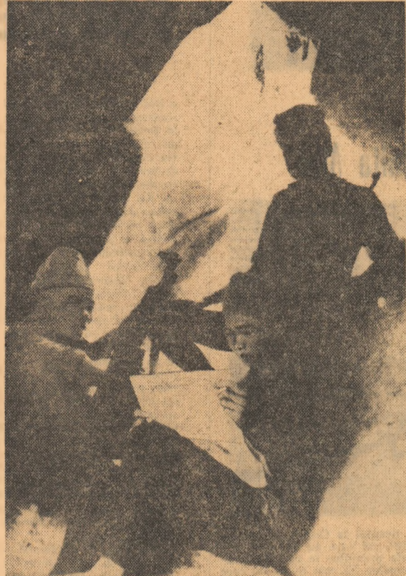
VIETNAMUL DE SUD. — Membri ai forțelor patriotice citind presa locală în pauzele dintre lupte