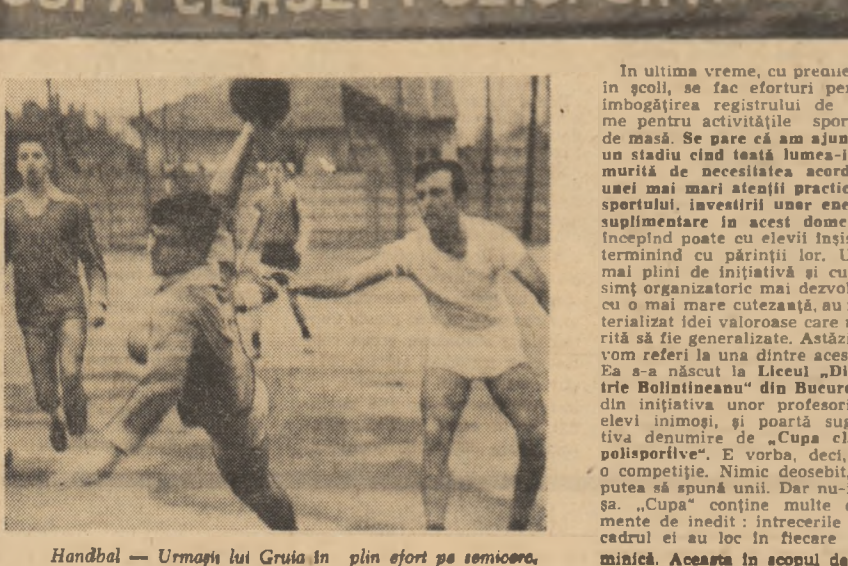
Handbal — Urmasii lui Grusa în plin efort pe semicerc.