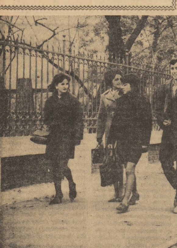
Studentii gălățeni în drum spre fauștate