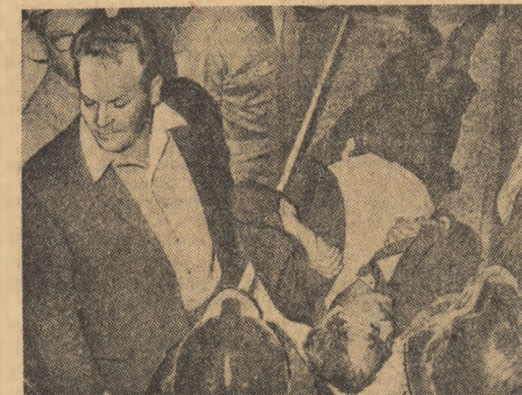
Corpul neînsoțit al ambasadorului R. F. G. în Guatemala, Karl von Spreti, după identificare

Thomson declarase că premierul Wilson respinge ideea ca prima rundă de tratative să aibă un caracter pur formal, rezumîndu-se doar la expunerea pozițiilor reciproce ale „celor șase“ și ale țării candidate la C.E.E. (Marea Britanie, Irlanda, Danemarca, Norvegia). Din acest punct de vedere, membrii Pieței comune au păreri oarecum diferite. Unii dintre ei doresc să-și expună, independent, poziția asupra condițiilor ce trebuie impuse solicitanților la aderare. În plus, un fapt nu lipsit de importanță, Anglia dorește, în ciuda intervențiilor pentru urgențarea startului, unii politicieni încercaseră să amâne începerea tratativelor pînă după deșeurarea alegerilor parlamentare, în prezent guvernul laburist insistă ca negocierile să se desfășoare chiar înainte de intrarea în „vacanța politică de vară“.