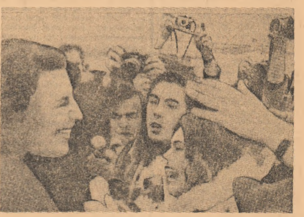
Compozitorul grec Mikis Teodorakis sosind pe aeroportul din Paris