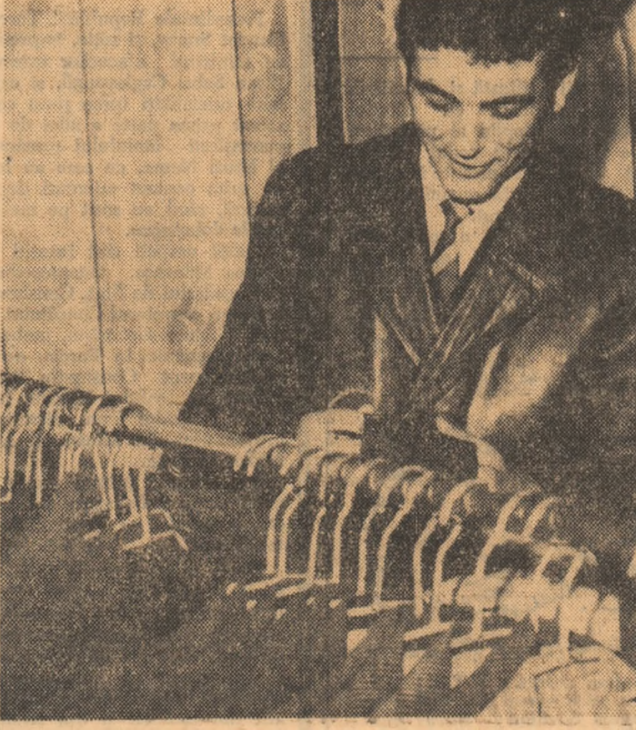
Se cercetează, în zadar, standurile de confecții. Promisiunile au rămas... promisiuni

„Magazinul „Adolescentul” din Capitală, cel mai reprezentativ în acest sens, se prezintă, și drept în această primăvară cu o serie de noutăți vestimentare dar, ale altor furnizori; nici unul din cele 210 modele promise atunci tineretului de către fabrica nu a fost expus în standurile magazinului. Nu am întîlnit acele superbe costume din bumbac, pantalonii, sacourii, paradiese cășate, fuste, rochii, bluze etc. — alt de atrăgător prezentat la paradă. Gestionarii, tinerii cumpărători ridică din umeri,