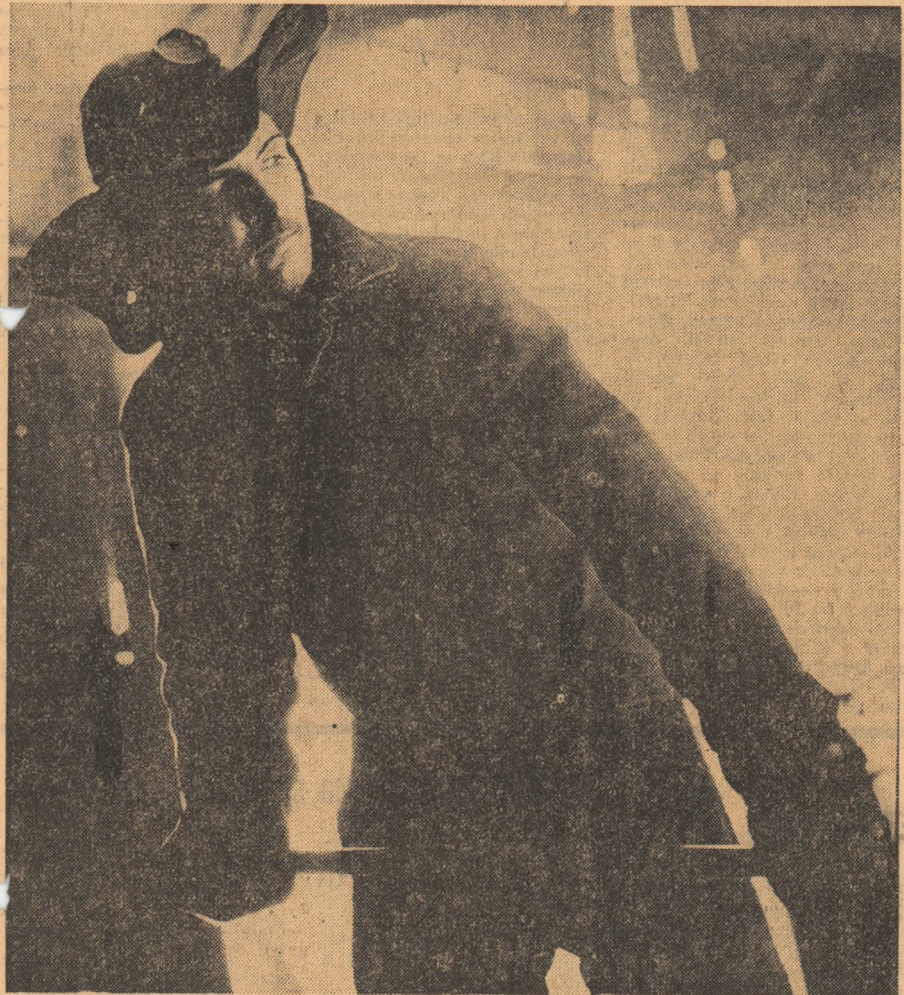
SCRISOARE DE PE ȘANTIERUL NAȚIONAL AL TINERETULUI LOTRU

Primirea s-a desfășurat într-o atmosferă cordială.