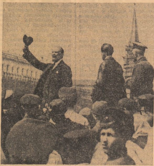
V. I. LENIN robind un discurs în Piața Roșie în 1919

Nu departe de aici, în gară, se poate vedea și locomotiva fier forjat, înșeurată de vreme și de priverile trecătorilor.