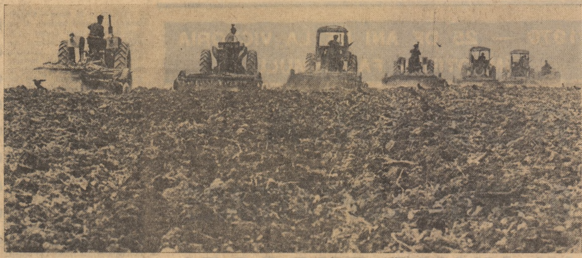
În aceste zile, pe ogoarele țării