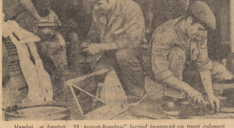
Membru ai brigăzii „23 August-România” lucrînd împreună cu tineri cubanezi