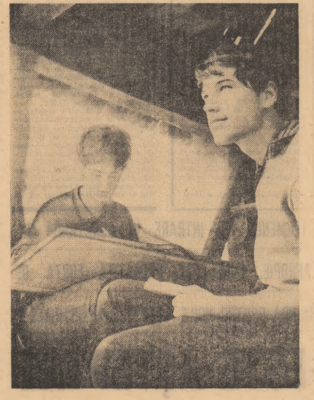
Muzeul Satului este și un obșnuit loc pentru documentare artistică

Cunoscutelor colecții editoriale tipărite de „Meridiane” li s-a adăugat recent, sub un titlu edificator, cea denumită „Țări și mari orașe ale lumii”. Primele lucrări ieșite de sub tipar prezintă două din grandioasele metropole ale zilelor noastre — Leningrad și Paris, „văzute” de artistul-fotograf Ion Miclea în 105 și respectiv 66 imagini esențiale și sugestive. Cîlitorii, oameni ai unei epoci dominante de verbu „a sti”, consumatori febrili de informații culturale, vor găsi curînd în librării albume, cu imagini comentate, din Budapesta și Roma.