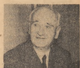
General-major NICOLAE ALECU

EUGEN FLORESCU (Continuare în pag. a II-a)