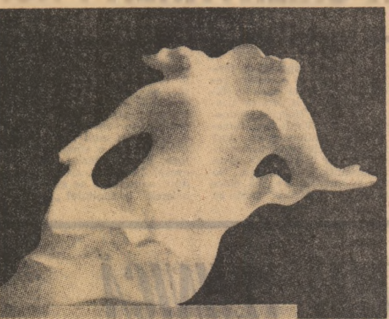
Ioana Kassargian — „Odă bucuriei”

„Golurile” și „plinurile” care-i dirijează compoziția acum nu fac decât să accentueze această caracteristică nouă și să o distanțeze implicit de materialitatea grea, de masivitatea volumelor pe care le cultiva în