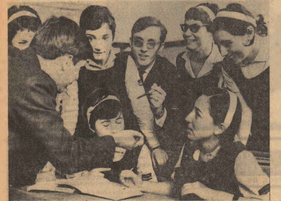
Comitetul U.T.C. al Liceului „Gh. Lazăr” din București discutînd planul de activitate pe trimestrul II