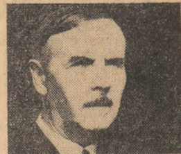
General-major IOAN BOTTEA