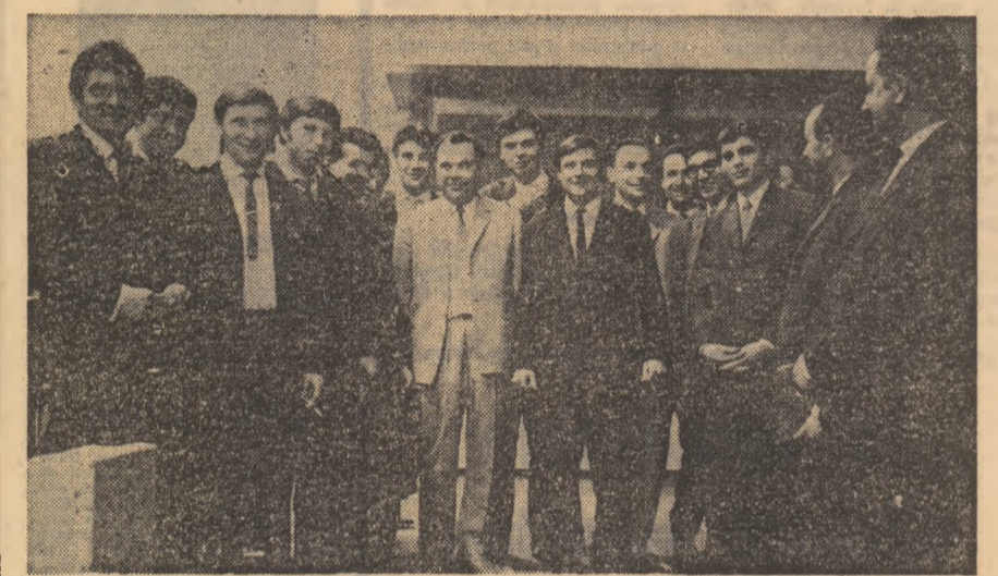
La sosire, pe aeroportul Băneasa

sentimentele de profundă prietenie ale tineretului român față de tineretul sovietic, față de tineretul tuturor țărilor socialiste. Am lucrat alături de tineri mongoli, coreeni, cehoslovaci, bulgari, germani, polonezi etc., ne-am înțeles foarte bine cu toții, am achimbat păreri și experiențe, am făcut noi și trănice prietenii, în spiritul prieteniei care unește tineretul țărilor noastre. În zilele pa-