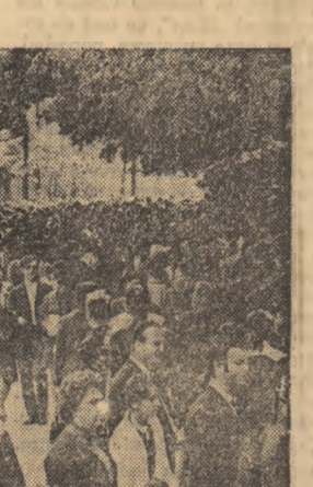
Zile de sărbătoare, zile de afluență pe străzile și în parcurile Capitalei

Vizionar, poetul socialist român scrisese: „Din idealurile noastre, / O, visători flămînzii și goi, / Vor răsări ca niște stele / Senine lumi cu oameni noi.” Imaginea generoasă a viitorului astfel