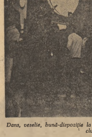
Dans, veselie, bună-dispoziție la carnavalul organizat de „Ecran-club”