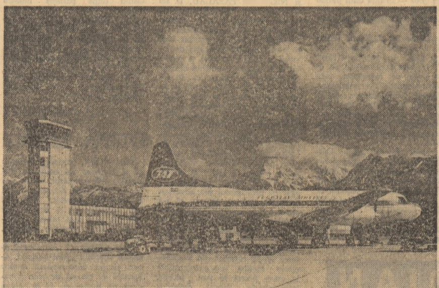
R. S. F. IUGOSLAVIA. — IMAGINE DE LA NOUL AEROPORT DIN LJUBLJANA