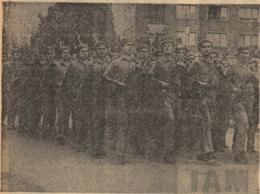
Defilează gazele patriotice. Aspect de la demonstrația oamenilor muncii din orașul Galați