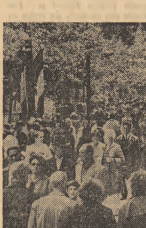
Zile de sărbătoare, zile de afluență pe străzile și în parcurile Capitalei

Vizionar, poetul socialist român scrisese: „Din idealurile noastre, / O, visători flămînzii și goi, / Vor răsări ca niște stele / Senine lumi cu oameni noi.” Imaginea generoasă a viitorului astfel