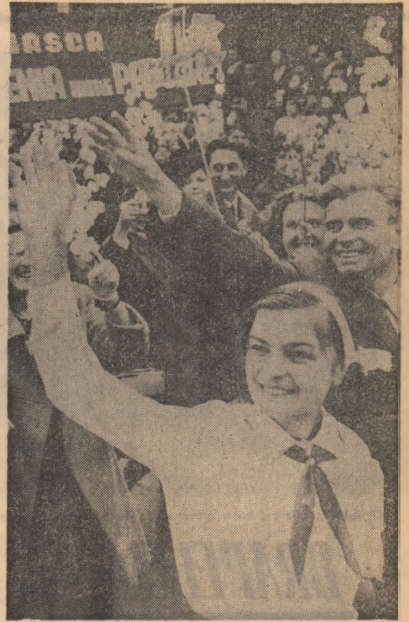
Voișoaia a însoțit tot timpul uriașele coloane de muncitori, funcționari, elevi și studenți din Timișoara

clasei muncitoare, a partidelor comuniste și muncitorești din lumea întreagă. Simbolul sub însemnul căruia s-au desfășurat amplele noastre festivități a fost acela al muncii pașnice, creatoare de valori și perspective, prestată cu încredere și abnegație în forța reunită a unor oameni eliberați de exploatare, stăpâni pentru totdeauna pe destinul lor. Urzile ale căror efluvii s-au împletit în piețele orașelor noastre au fost, totodată, un călduros omagiu adus Partidului Comunist Român, Comitetului său Central, în frunte cu tovarășul Nicolae Ceaușescu, liniei sale politice clarvăzătoare, care ne conduce spre noi izbînză, întru înflorirea continuă a patriei.