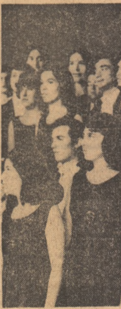
CORUL DE CAMERA „GAUDEAMUS”, al Casei studenților din București — o revelație a Festivalului

ADNOTARI LA FESTIVALUL NAȚIONAL STUDENTESC AL FORMAȚIILOR CORALE ȘI INSTRUMENTALE