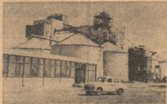
Fabrica de furaje combinate din Beregău, județul Timiș

LA ROMAN: Laminorul de 6 țoli în probe tehnologice