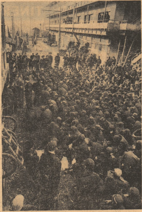
JAPONIA. — În sprijinul revendicărilor lor, fermierii japonezi au declarat recent o grevă de 24 de ore, în timpul căreia au organizat o serie de manifestații. Fotografia noastră prezintă o imagine de la un miting al greviștilor, în cursul căruia aceștia și-au formulat revendicările

STOCKHOLM 4 (Agerpres). — Condamnînd intervenția trupelor americane în Cambodgia, precum și reluarea de către aviația S.U.A. a bombardamentelor asupra teritoriului R.D. Vietnam, primul ministru suedez, Olof Palme, a subliniat că guvernul Suediei se disociază fără vreo posibilitate de echivoc de o asemenea acțiune care echivalează cu reînnoirea războiului și cu angajarea în război, în locul căutării unei soluții pașnice”. În aceeași zi, la Stockholm au avut loc demonstrații împotriva politicii americane în Asia de sud-est. Participanții s-au îndreptat în cursul după-amiezii spre Ambasada S.U.A. din Suedia, precum și spre Centrul cultural american din Stockholm, pentru a-și exprima protestul împotriva pătrunderii trupelor americane în Cambodgia.