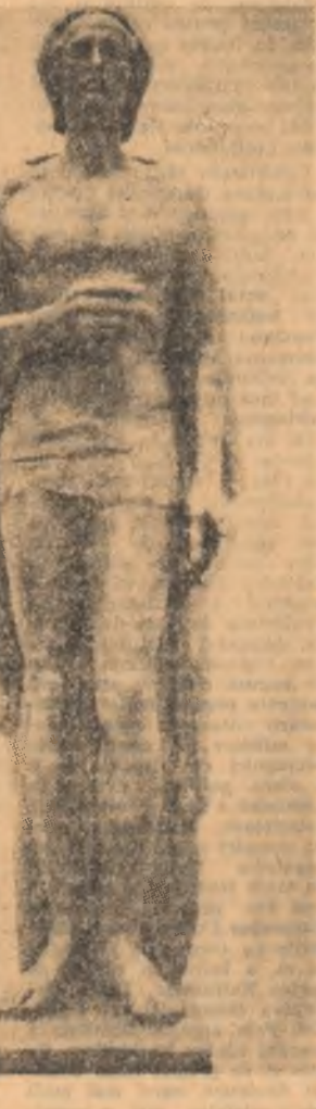
Continuăm ancheta a cărei primă parte am publicat-o în ziarul nostru din 23 aprilie

Conștința artistică a acestui romanțier operează cu unități mai mari decît cele obișnuite. Există scriitori, chiar printre cei însemnați, care nu-ți îngăduie să judeci altfel decît pe opere întregi. Fecmăsură parțial, care se poate încadra într-un chenar, nu-l interesează: între aceștia se numără cel ce a scris Francica, în absența stăpînitorilor (1960), Animate bolnave (1968). Din Dostoievski și vinu greu să separe un fragment oarecare dintr-o carte și să-l citești cu voce tare unor prieteni, pentru a le face plăcere. Avem impresia chiar că însuși actul lecturii e oarecum diferit în cazul scriitorilor din această familie (de care ține Breban). El nu-ți plac pur și simplu, nu te desfață, e-ți înșelă altceva. Un Turgheniev îți pune în față priveliștea delictantă a unui lăvezi înflorit, a unor deliciați și albi mestececi; sufletul îți e cu plăcere modest, pagini anume te recheamă; Gogol sau Dostoievski, te îngăduie alături purfîndu-te prin prăpăstii înspăimîntătoare, ei coboară, culoarea mereu, drumul de înapoiere (în real) devine aproape cu neputință din abisurile omului. Modelarea e aspră, te simți tratat cu violență, zdrobit. Itevenși la lume înțelegi că nu în amabile excușii de extrovertire te cheamă ei, și, lucru fundamental, că fiecare călătoria de aceasta trebuie făcută pînă la capăt, cu gravitate. Nu sîntem obișnuiți să citim dintr-o pagină și lăsa în