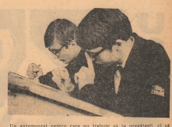
Un extemporal pentru care nu trebuie să te pregătești, ci să fii cînstiț, și să răspunzi „de ce ai nota scăzută la purtare?” Dar, după cum se vede, subiectul e foarte complicat!

PENTRU CE LA LICEUL DUMNEA- VOASTRĂ SE SCADE