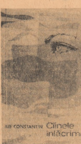
ILIE CONSTANTIN Cîinele înlăcrimat