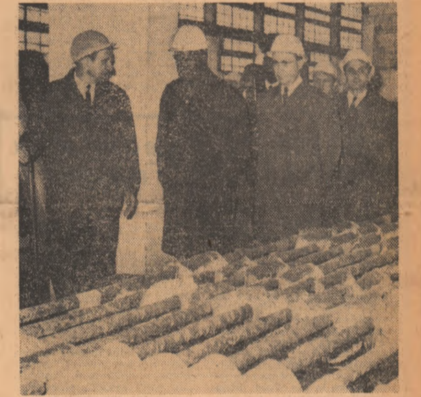
În vizită la Uzina metalurgică de metale neferoase

Înaintea începerii recepției au fost intonate imnurile de stat ale celor două țări. Recepția s-a desfășurat într-o atmosferă caldă, prietenească. (Agerpres)