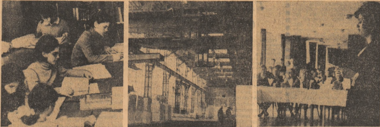
1. Biblioteca Facultății de chimie. Studenții se pregătesc asiduu pentru sesiune