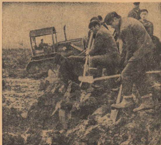
Aici, la locul căruia brăilenii îi spun „Vărsătura”, o frîntură din marea bătălie ce se poartă la Dunăre: neosenteți, clipă de clipă, în calea apelor se ridică noi diguri

● Prin muncă și numai prin muncă vom putea recupera o parte din uriașele pagube, vom face ca iarna de care ne despart doar cîteva luni să nu găsească oameni fără adăpost, iar pe masa copiilor să se afle destulă hrană!