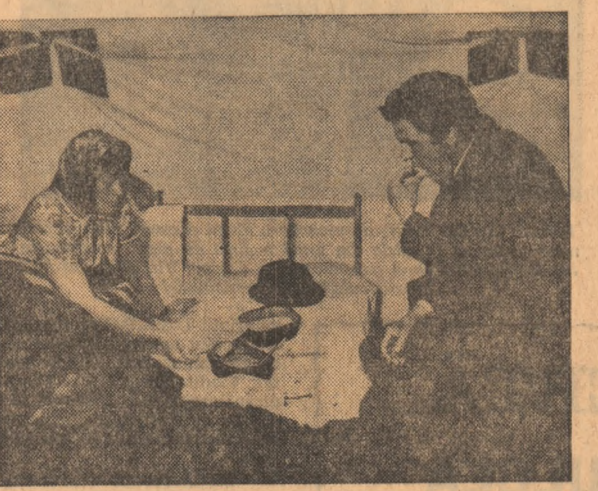
SATU MARE: La adpostul corturilor ce le-au fost trimise ca ajutor, acești oameni rămași fără casă, redescoperă, după mai multe zile de groază și suferință, gustul unei mîncări calde

Pentru acțiunea de dezinfecție a apelor, ambarajului și încăperilor, la Satu Mare au sosit 3,5 vagoane de var neagră, 300 kg cloramină și 1800 kg substanțe bromate. De asemenea, peste 38 de medicii s-au îndreptat duminică spre satele lovite de calamitate, pentru a acționa împotriva apariției unor boli infecțioase.