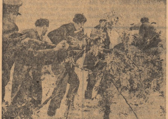
Și la Odobești, în calea apelor care amenință câmpuri roditoare și așezări omenești se ridică într-o impresionantă concentrare voința oamenilor