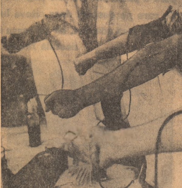
Brațe tinere gata de orice sacrificiu

S-au găsit în primul rînd la copii. Apele în furia lor, au dărîmat case, creșe, școli. Numeroase familii au rămas fără adăpost. Dar copiii? Ce vor face copiii? „Temporar, pînă cînd situația se va normaliza — au afirmat, în cadrul unei adunări, studenții Academiei de Studii Economice din București — noi dorim să găzduim 600 de copii...” Acum un întreg șmin, Complexul social „Ștefan Furtună” al Academiei de Studii Economice, așteaptă oșpeți: copii din județele lovite de calamități. Studenții s-au restrîns în celelate cămine, în camerele colegilor lor. Dar gestul lor de solidaritate cu oamenii din zone-