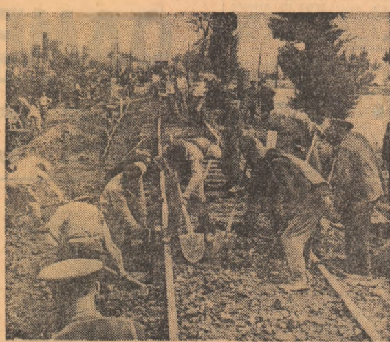
Eforturi îndrăgite a sute de muncitori, țărani și ostași, eforturi care n-au cunoscut în zilele din urmă o clipă de răgaz, consemnate lapidar de textul unui comunicat: pe distanța Vințului de Jos-Alba Iulia circulația a fost restabilită!

jat, de asemenea, să dublăm beneficiile de la 1,7 milioane la 3,5 milioane lei. Paralel cu eforturile de sortare a producției ne-am îndreptat forțele și spre activitatea de prevenire a inundațiilor.