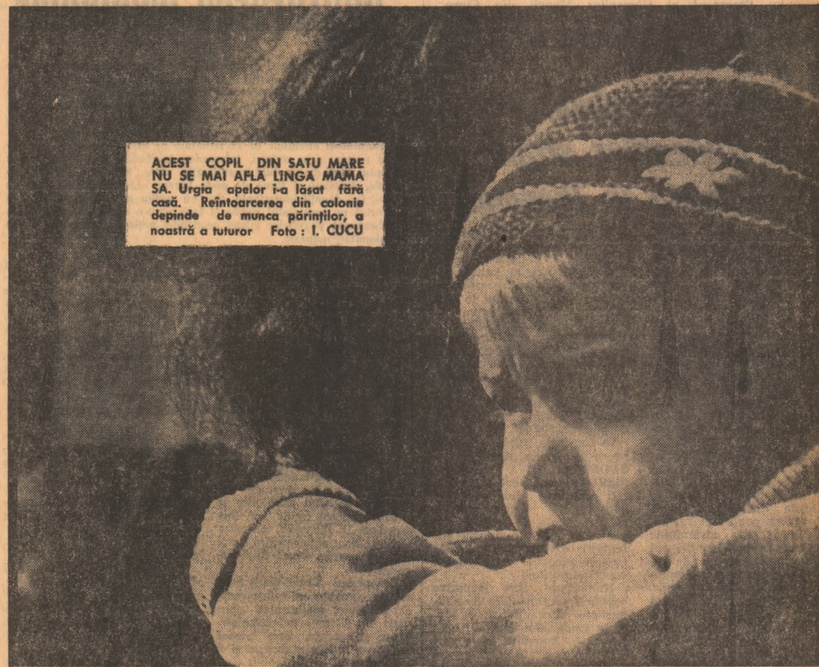
ACEST COPIL DIN SATU MARE NU SE MAI AFLA LINGA MAMA SA. Urgia apelor l-a lasat fara casa. Reintoarcerea din colonie depinde de munca parintilor, a noastra a tuturor

(Urmare din pag. 1) de la Hunedoara, Brad sau Certeji. Apa avea mai bine de un metru adancime cind a inceput refacerea fabricii, careia inundațiile l-au adus daune în valoare de peste 350 000 lei. Într-o singură zi s-au scos din halele inundate circa 200 metri cubi de noroi. Echipe speciale de înaltă calificare au început refacerea cuptoarelor, arzătoarelor și elevatorilor grav avariate. Lucrările sînt pe sfîrșite. Teri se monta partea mecanică la elevatorii și se vopseau din nou toate utilajele. Cuptoarele însă erau calde. — Marți 26 mai — ne informează inginerul Dumitru Fleancu, directorul întreprinderii de panificație — vom coace prima piine.