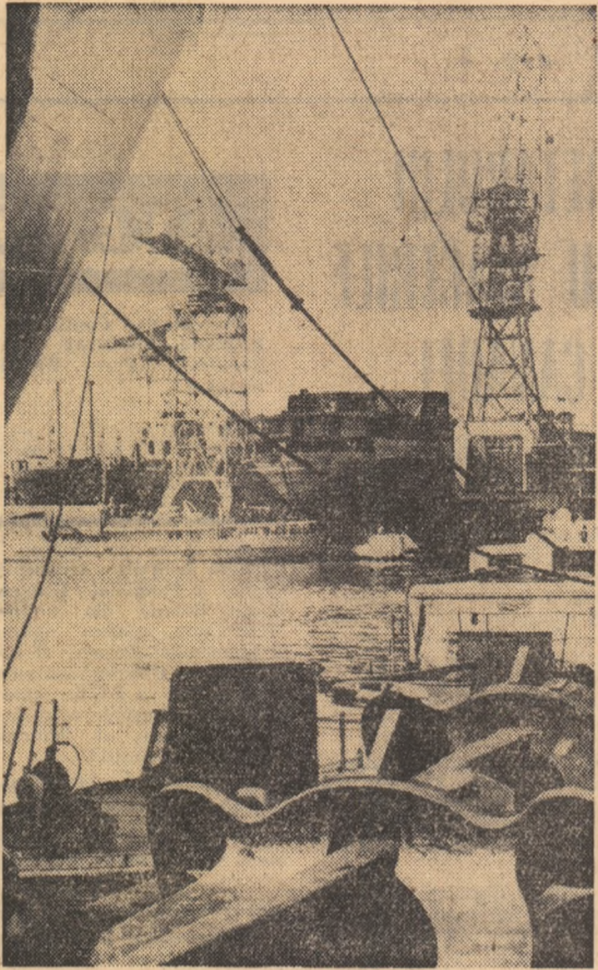
R.P. BULGARIA. Șantierul naval din Varna.

Delegațiile de tineret din străinătate, printre care și delegația C.C. al U.T.C., au depus o coroană de flori la Mausoleul lui Lenin din Piața Roșie.