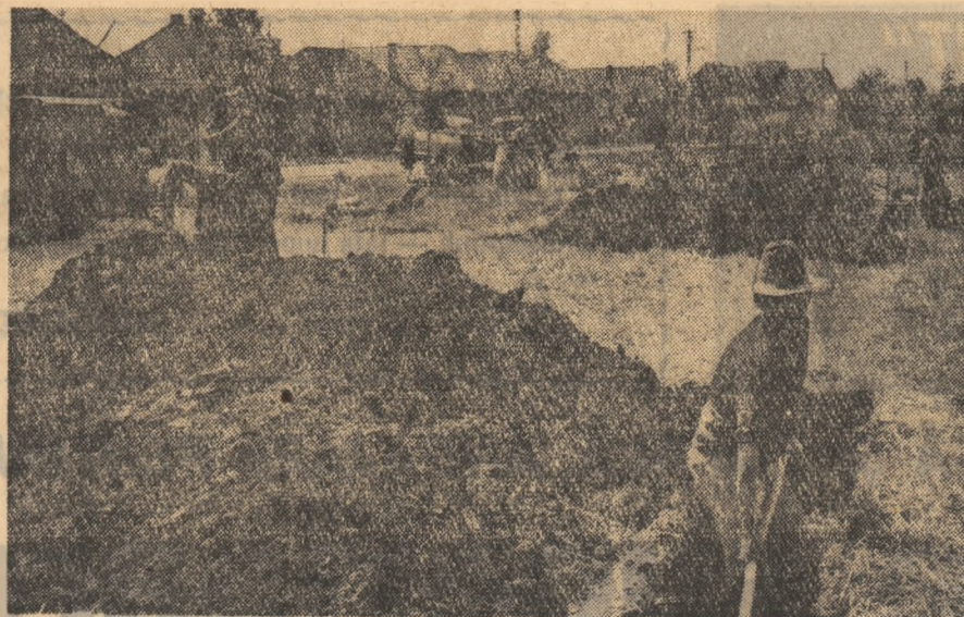
În comuna Cipău, județul Mureș, s-a deschis un nou șantier de locuințe: se fac săpături pentru fundația viitoarelor case ale locuitorilor sinistrați