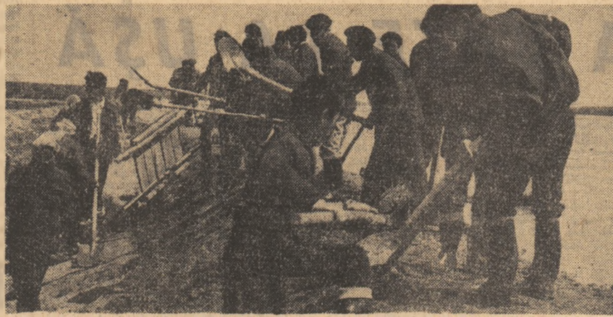
Ziua și noaptea tinerii lucrează la marea din pentru protejarea orașului Galați de viitura fluviului

Publicăm în pag. a IV-a un reportaj despre ce s-a întâmplat în comuna Murgești, despre eforturile ce se fac acum de către toți locuitorii comunei pentru revenirea la normal.