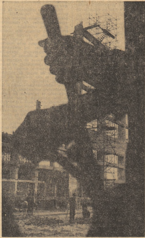
Pretulindeni acolo unde apele n-au ajuns să-și imprime efigia distrugătoare, brațele hîrnice ale oțelului neîntrerupt pentru a realiza cât mai mult, cât mai bine.