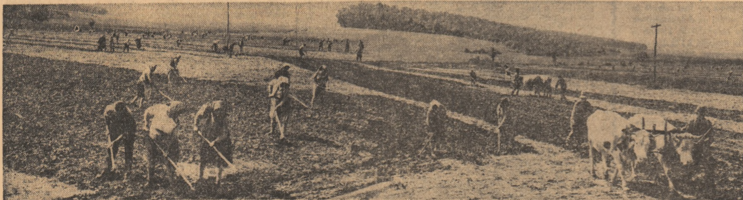
C.A.P. Tîrnăria: lucrări de întreținere (prăjiți) la sfacla furajeră.

În toate timpurile, omul este acela care face istoria Interviu cu EUGEN BARBU