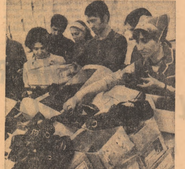
Tinerii de la Fabrica „Ardeleanu” din orașul Alba Iulia au reconștitat circa 7.000 de perechi de încălțămînt afectate de apele incolburate.

tate între stațiile Baldoinești și Vădeni, iar a treia în Văleni și Barboși. Totalul gubului: peste 11 milioane. A doua zi s-a pornit la treabă. Conform calculului specialiștilor, pentru reluarea circulației trebuiau dislocate imediat circa 300 brațe de muncă. Erau necesare apoi zeci de rețele, buldozere, compactoare macarale, grupuri electrice și nu mai puțin de 51.000 mc pîduse de carieră, cele necesare au fost aduse pe șantier. E atunci munca se desfășoară fără contenire.