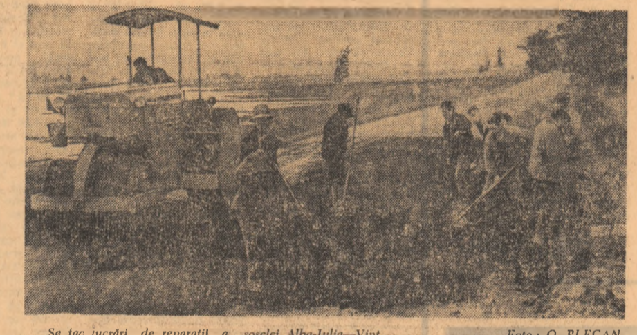
Se fac lucrări de reparații a șoselei Alba-Iulia-Vînț.