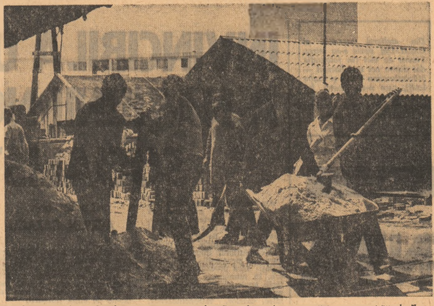
Elevii Grupului şcolar de construcţii-montaj din Capitală au fost prezenţi în patru unităţi ale Fabricii de cărămidă