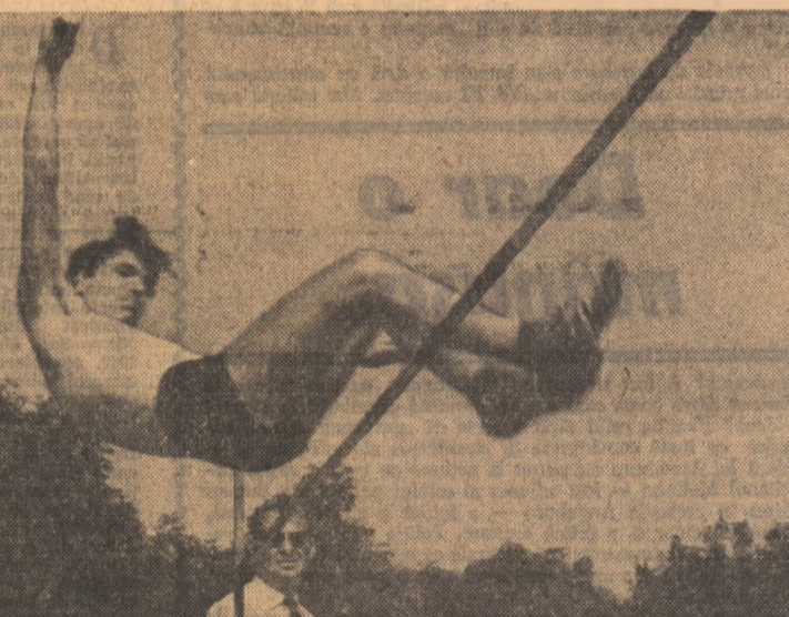
Modernul procedeu tehnic „Fosbury-flop” de la înălţime n-a fost un secret pentru mulţi dintre concurenţi. Campionul începătorilor a trecut în acest stil 1,70 m!

● ÎN ZIUA de două a turneului internaţional de polo pe apă de la Borovno (Iugoslavia), reprezentativa iugoslavă a învins-o cu scorul de 9-4 (2-0, 0-1, 4-2, 3-1) echipa Spaniei. Într-un alt meci, selecţionata R.F. a Germaniei a dispus cu 7-5 (2-0, 1-0, 1-0, 3-0) de formaţia Cehoslovaciei.