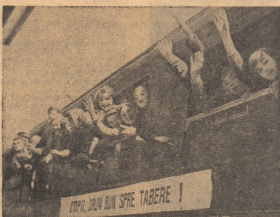
Odată cu primirea celor 442 de copii din județele Alba și Mureș, greu lovite de calamitățile naturale, tabăra de la Năvodari și-a deschis porțile