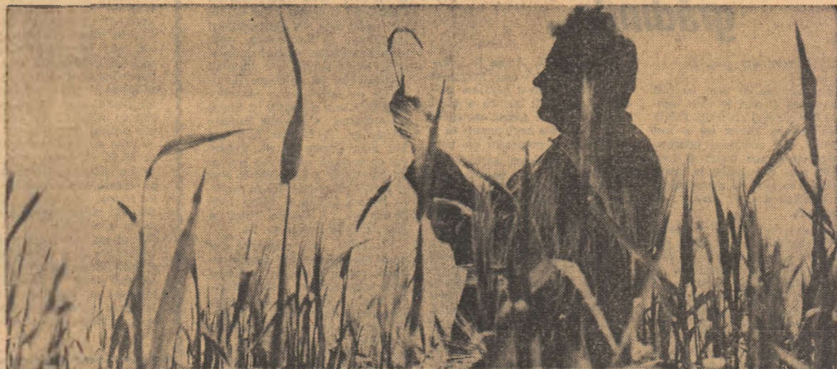
Zori de zi în lanurile de orz ale cooperativei agricole din Mouliza