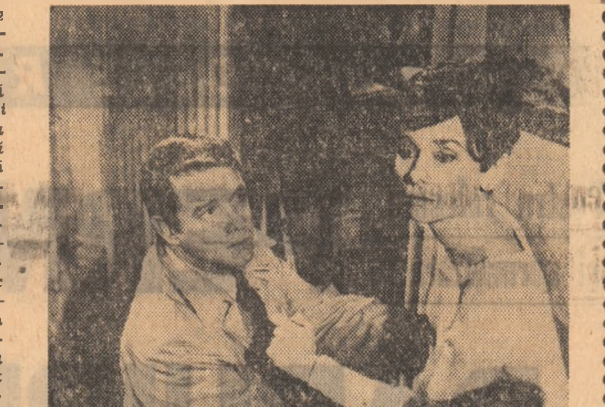
Audrey Hepburn într-una din scenele de mare tensiune din filmul „Aşteaptă pînă se întineacă”

„...îşi află o rezolvare doar graţie vizitei făcute la bunica, medic veterinar, profesor al unei frumoase proprietăţi la ţară. Aici în mijlocul unor dragi amintiri ale copilăriei renaşte dragostea sofului pentru soţia sa. Filmul are un ton uşor moralizator, care nu deranjează însă. Michel Simon, în rolul principal, dă cu graţie şi farmec lecţii de bun simţ şi delicateţe unui soţ adulterin. Filmul este o melodramă, fără mari pretenţii, desigur, dar cele câteva adevăruri simple pe care le descoperă cei