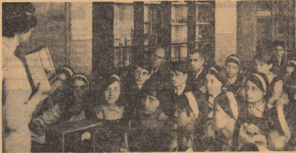
Oră de fizică în laboratorul Liceului din Butea.