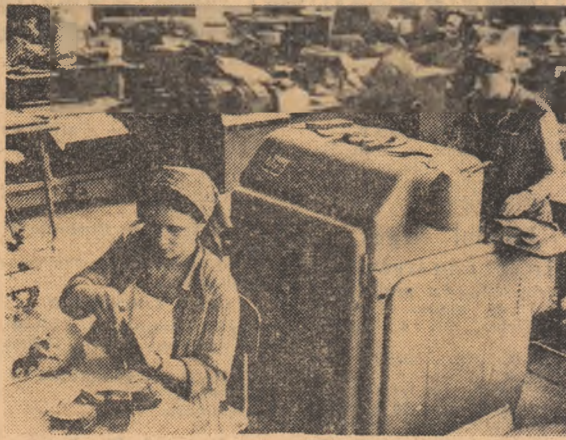
Fabrica „Ardeleana” din Alba Iulia: pe zi ce trece, ritmul producției revine la normal.