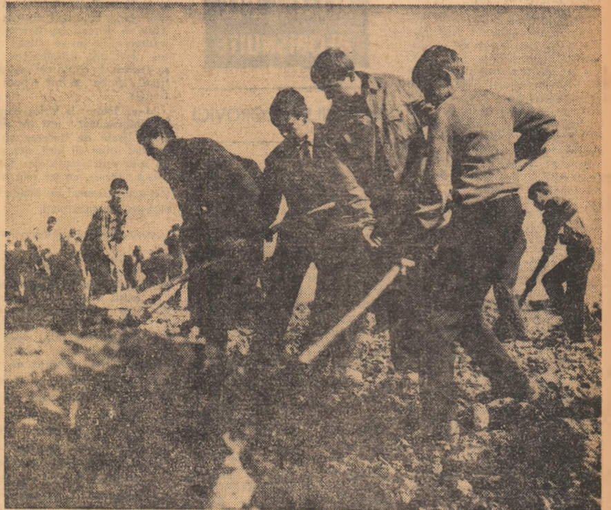
Tineri din județul Ilfov la punctul de lucru Mouliza.