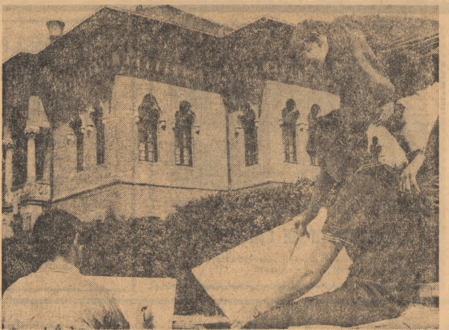
Viitori candidați la Institutul de arhitectură în vizită la Muzeul Mogosoaia.

teci de acolo, filială a acesteia comunale, un program de funcționare, măcar de o zi pe săptămîni.