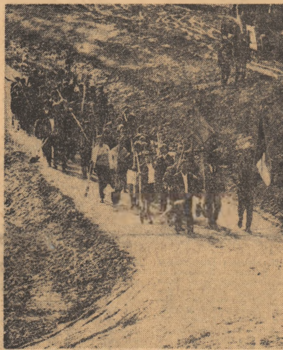
Mii de tineri muncesc cu elan și dăruire în aceste zile, constituți în șantieri de muncă patriotică ale tineretului