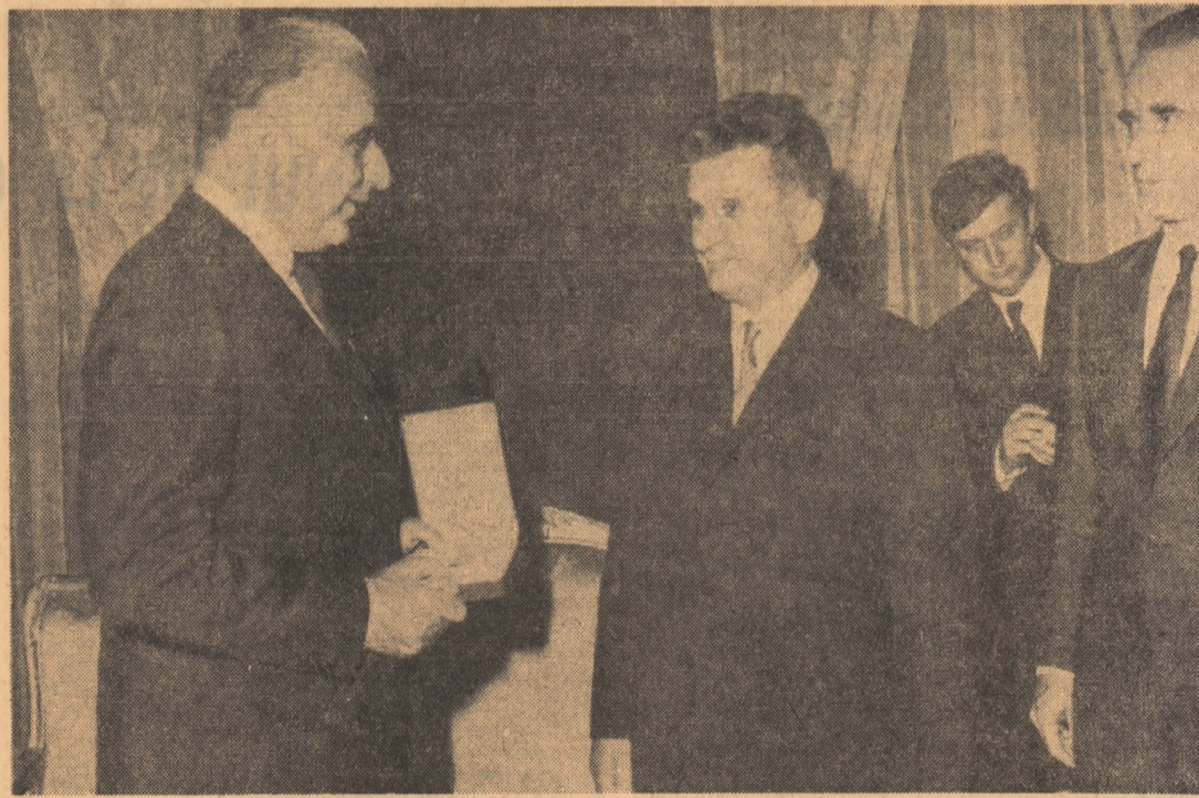
Moment solemn la Ambasada română: președintele Nicolae Ceaușescu înmânează președintelui Georges Pompidou, ca un simbol al prieteniei româno-franceze, „Steaua Republicii Socialiste România” clasa I.

Sint comentate, de asemenea, ca oglindind prietenie și considerație omniurale rezervate de conducătorii Franței președintelui român. Într-adevăr, dinelul oferit luni seara de președintele Pompidou la palatul Marele Trianon în cinstea tovarășului Nicolae Ceaușescu și a soției sale a fost o mărțurie grațioasă în acest sens. În marea curte de onoare, străjuită de masive porți poleite în aur, înalții oaspeți români au fost întâmpinați cu ceremonial militar, de președintele Pompidou și soția, dna Pompidou. Palatul, o construcție