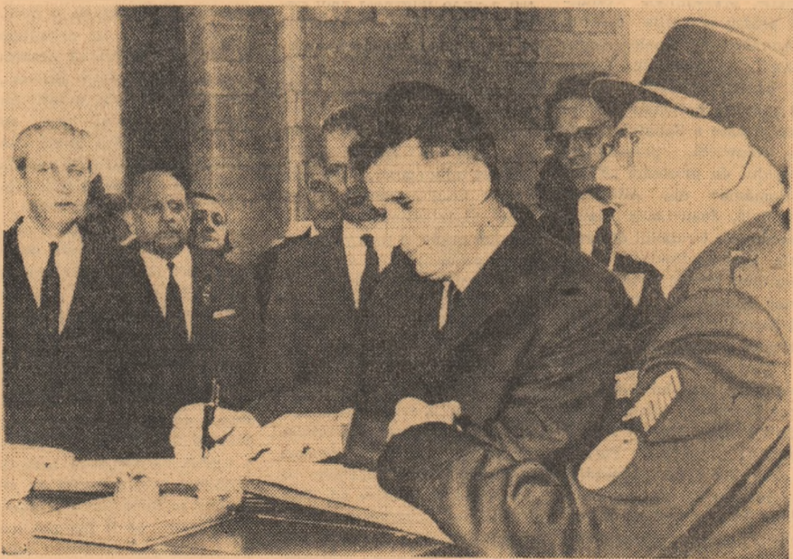
La Arcul de Triumf, președintele Nicolae Ceaușescu semnează în Cartea de aur. Este un volum mistic de pagini în care și-au așternut semnătura înalte personalități ale lumii contemporane.