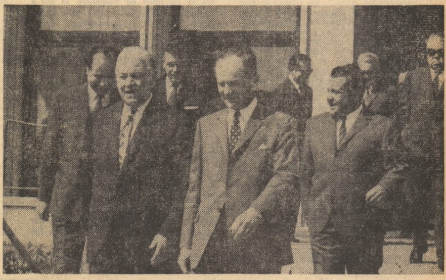
La plecare, pe aeroportul Băneasa