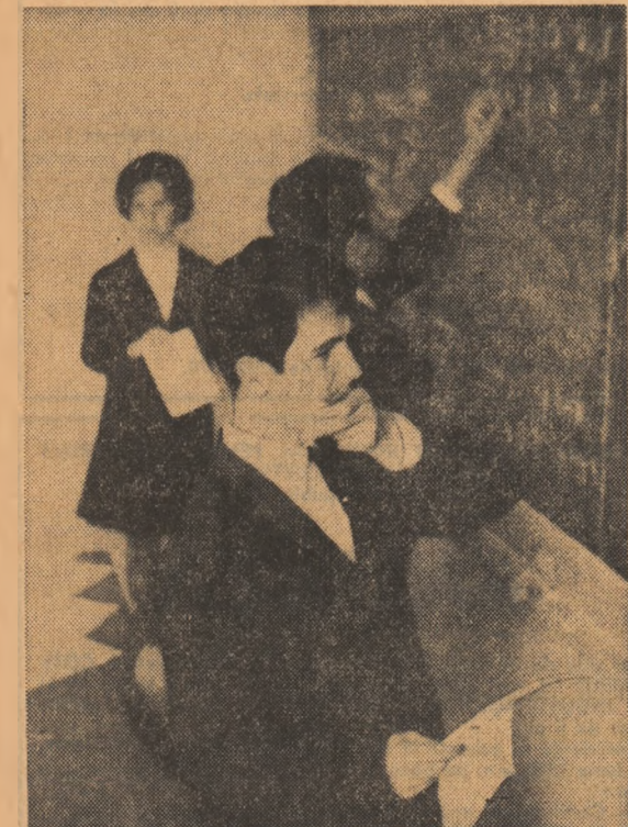
Examenul sînt încă în deplină actualitate. În curînd însă o bună parte din studenți vor putea fi reintinși în amfiteatrele muncii.