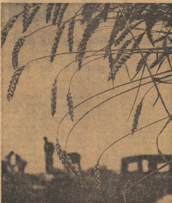
Prin lanurile de grâu ale cooperativei Dor Mărunt.