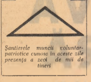
Santierele muncii voluntar-patriotice cunosc in aceste zile prezenta a zecii de mii de tineri