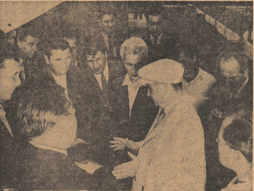
Tovarășul Nicolae Ceaușescu în mijlocul cooperativelor de la Roșiori de Vede