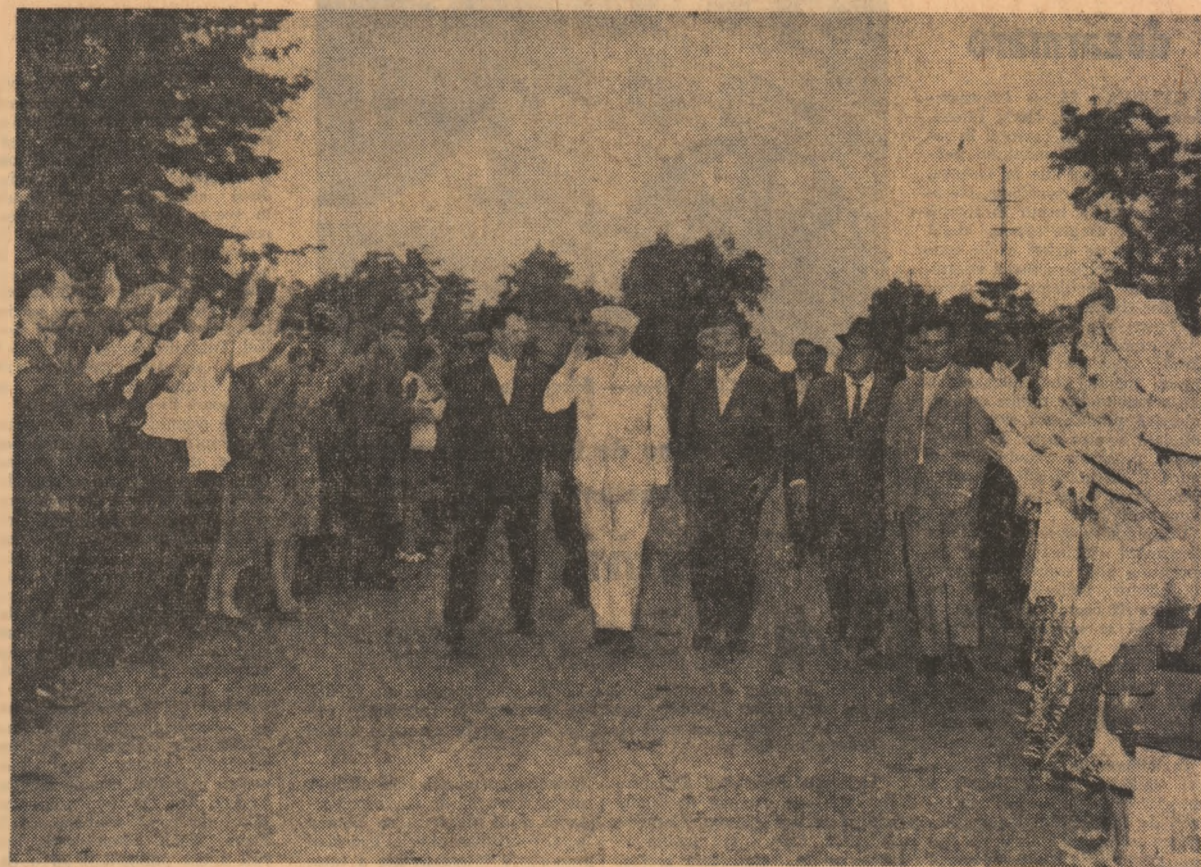
Locuitorii Scorniceștilui fac o primire emoționantă, plină de căldură tovarășului Nicolae Ceaușescu

ducție. Se vizitează în continuare sectorul zootehnic al cooperativei, care cuprinde 1.500 taurine, tot atîtea porcine și 1.200 de oi. Răspunzînd întrebărilor, zăzdele arată că atenția cooperativilor este îndreptată spre extinderea acestui sector, care anual adaugă în venitul cooperativei importante sume bănești. Rezultatele obținute sînt edificatoare atât în ce privește sporirea numărului de animale cît și a producțiilor de carne și lapte obținute. Alt succes al cooperativilor din Stoicanești este și faptul că anul trecut ei au cîștigat premiul I pe țară la producția de lapte. De la fiecare vacă furajată au obținut în medie 3.152 de litri de lapte. Prevederile pe anul în curs sînt și mai mari. Se prevede obținerea unei producții de circa 3.000 litri la vacă.