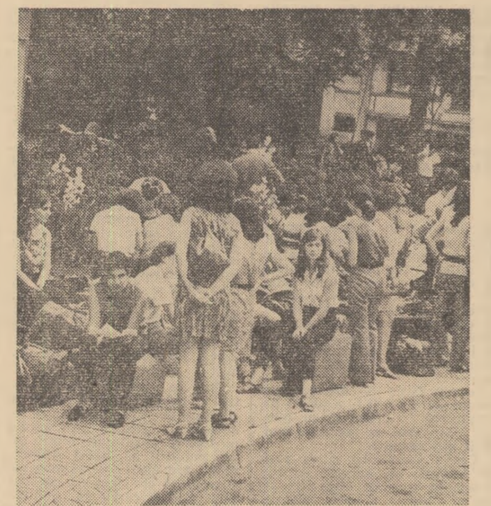
Studenții Facultății de filologie, secția limbi străine — București, înainte de a pleca spre Rîmnicu Vilcea.

Azi au loc alte plecări. Studenții vor munci. A fost de rînd. Studenții se vor odihni. Va fi dreptul lor, meritat, după în- vîțătură și muncă. Vacanța își urmează cursul obișnuit, pe care îl știm de atîția ani. Obșnu- tul acesta însemnînd zilele petrecute pe malul mării, baza de Căstănești, în taberele de la Pîrîul Rece, Busteni, Brasov — 10.500 de studenți, bilete de o- dihnă în alte 21 de stațiuni pen- tru aproape 4.500 de studenți, invitațiile B.T.T. la excursii pentru 6.000 de studenți, casele de cultură și cluburile, cu pro- gramele lor estivale, bazele sportive, taberele de instruire. Trebuie să recunoaștem, nu începe o vacanță oarecare, ci vacanța—1970, care a emis che- mări la muncă, chemări la o- dihnă și distracție. Incît, cea 150.000 de studenți vor putea spune la 1 octombrie: am stră- bătut o vacanță inegalabilă.