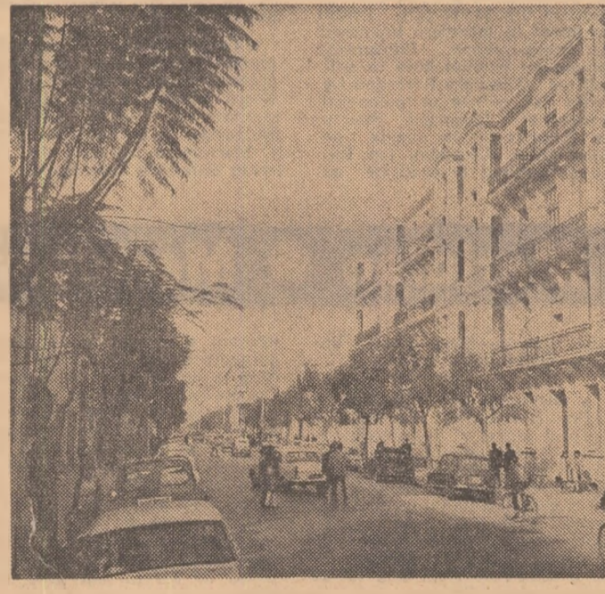
Imagine din Tunisia

La Berlin a avut loc o întîlnire între o delegație a Consiliului Central al Uniunii Social-Democrate din învățămîntul superior din R.F.G. și Germaniei (S.H.B.) și reprezentanții Consiliului Central al Organizației de tineret din R.D. Germană (F.D.J.). Tema convorbirii desfășurate cu acest prilej — informează agenția A.D.N. — a fost contribuția tineretului la lupta pentru asigurarea păcii și securității în Europa. Membrii delegației vest-germane s-au pronunțat pentru recunoașterea din punct de vedere a dreptului internațional a R.D. Germane de către R.F.G. și au salutat Memorandumul guvernelor țărilor participante la Tratatul de la Varșovia, adoptat la conferința de la Budapesta, ca un pas important pe calea spre Conferința general-europeană pentru securitate.