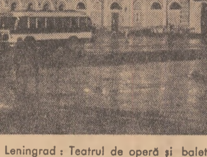
Leningrad: Teatrul de operă și balet „Kirov”

Convorbirile cu președintele țării gazdă, a anunțat postul de radio Damasc, au fost axate pe probleme ale relațiilor bilaterale și pe cele privind actuala evoluție a situației din lumea arabă.