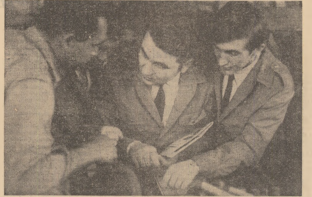
Imagine obișnuită la centrala „Jose Marti”: tineri români și cubanezi discutând, despre probleme ale muncii