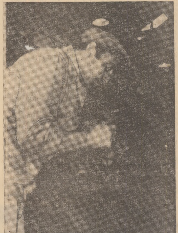
Tinerii români și-au câștigat un binemeritat prestigiu datorită seriozității în muncă

Prezența tinerilor români la Zafra din acest an a contribuit la consolidarea legăturilor de prietenie dintre tineretul celor două țări, dintre popoarele României și Cubei.