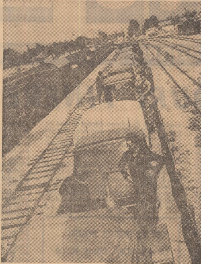
Imagina de față reprezintă un instantaneu realizat în gara Căzărași zilele trecute. Semnificația ei se poate rezuma în câteva cuvinte: pe 26 mai o grupă de opt tractoare cu respective tractoriști aparținând întreprinderii de mașini agricole Roseji, județul Ialomița au plecat spre Baia Mare, cu destinația comuna Arduș, satul Colțeni. Ajuși acolo s-au apucat urgent de treabă și în câteva zile au arat, au pregătit și au reînsămânțat ogoarele pustite de inundații pe mai bine de o sută de hectare. În clipa declanșării aparatului fotografic trenul cu care acești oameni demni de tot respect se întorceau acasă, intrase de câteva minute în gară.

Tratatul va fi apoi examinat în cadrul sesiunii Prezidiului Sovietului Suprem al U.R.S.S.