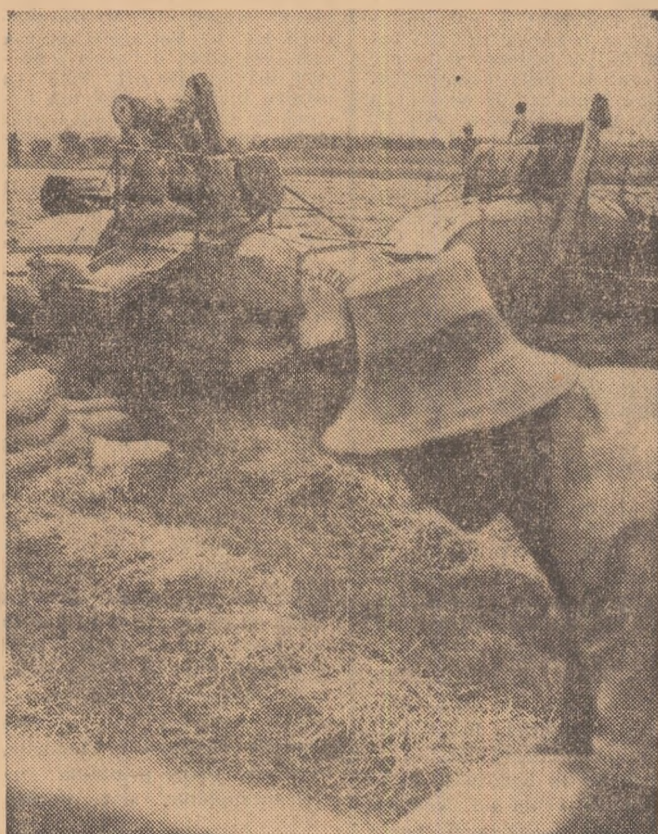
Recoltatul griului la C.A.P. Crăciunel, județul Alba