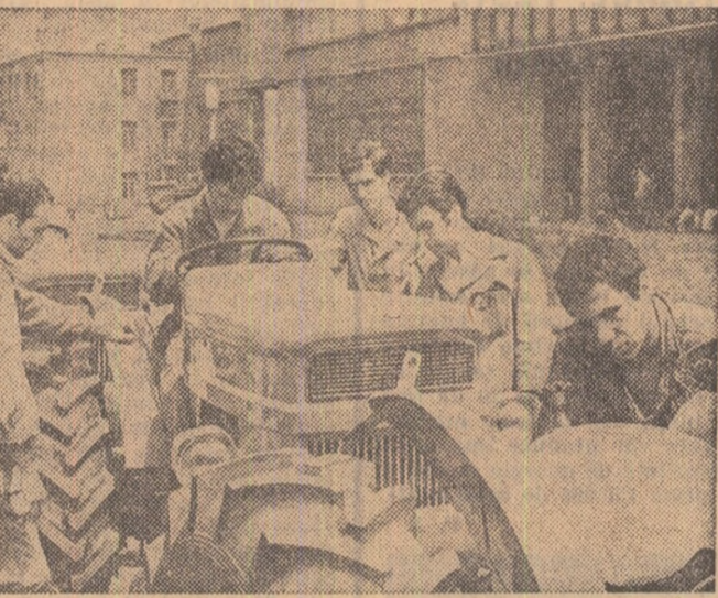
Studentii ai Institutului Politehnic din Braşov la o oră de practică la Uzina „Tractorul”.