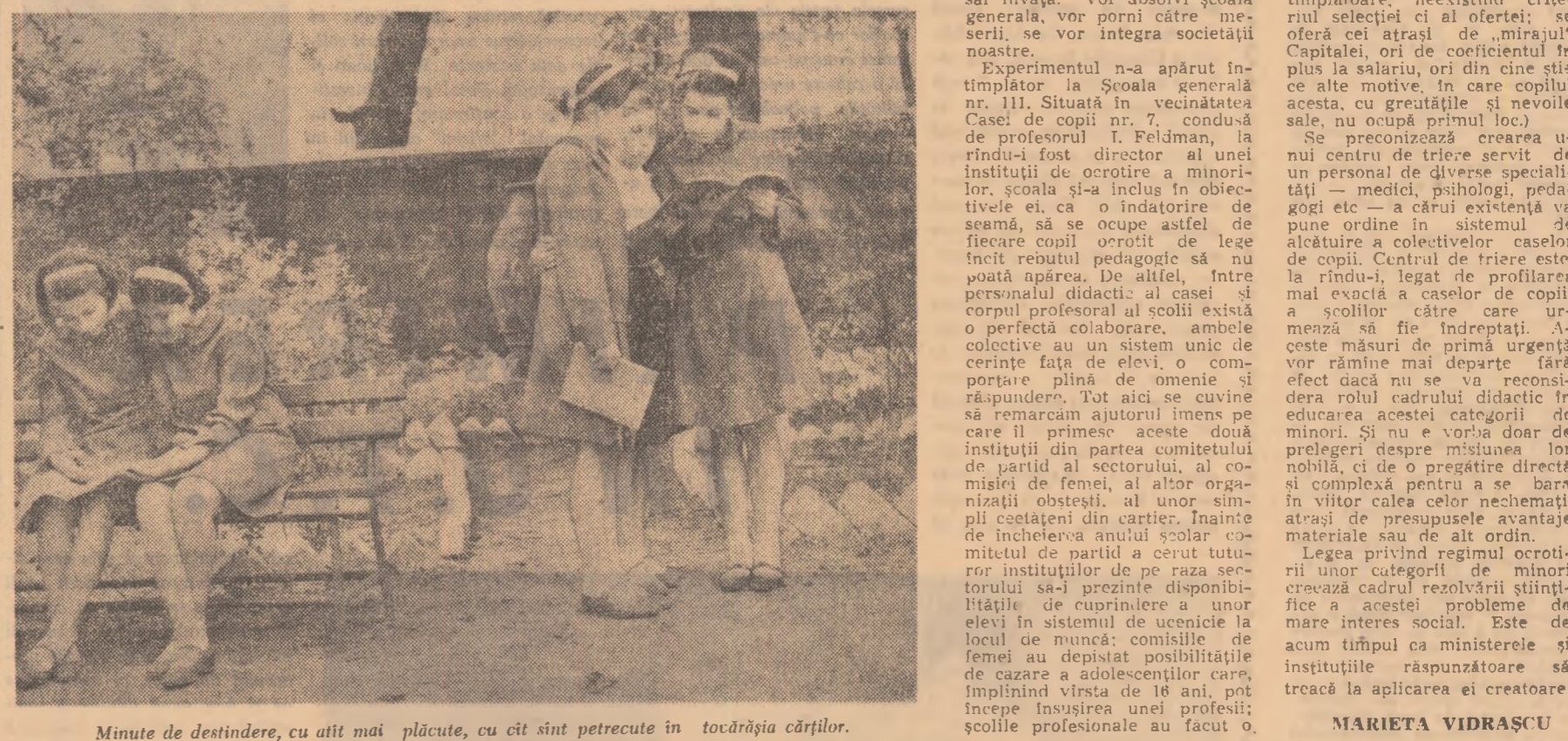
Minute de destindere, cu altă mai plăcute, cu cit și petrecute în tocărășia cărților.