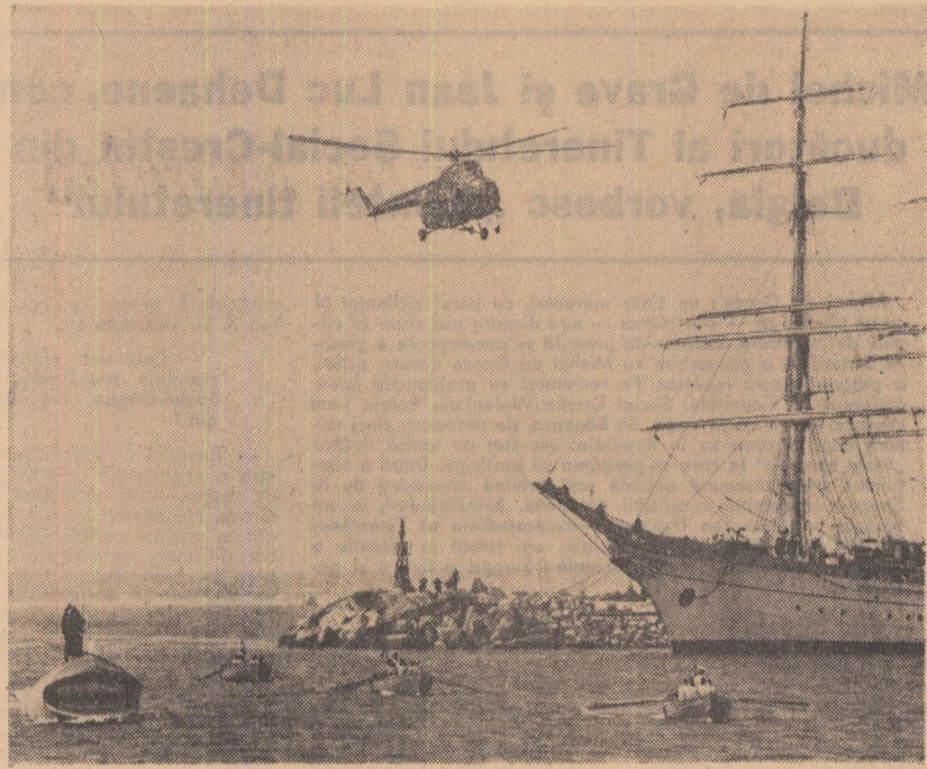
In neobișnuitul spectacol totul a respirat imaginație, voinție și în nu mai mică măsură, bună pregătire.