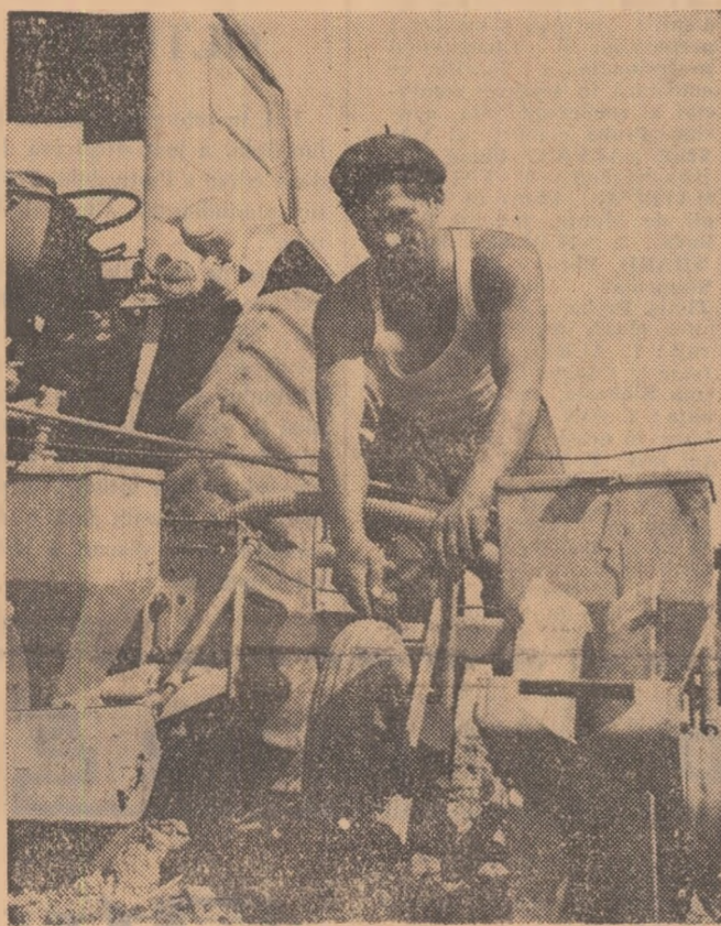
Pe terenurile I.A.S. Titu, județul Dimbovița, se însămînțează porumb furajer în cultură succesivă