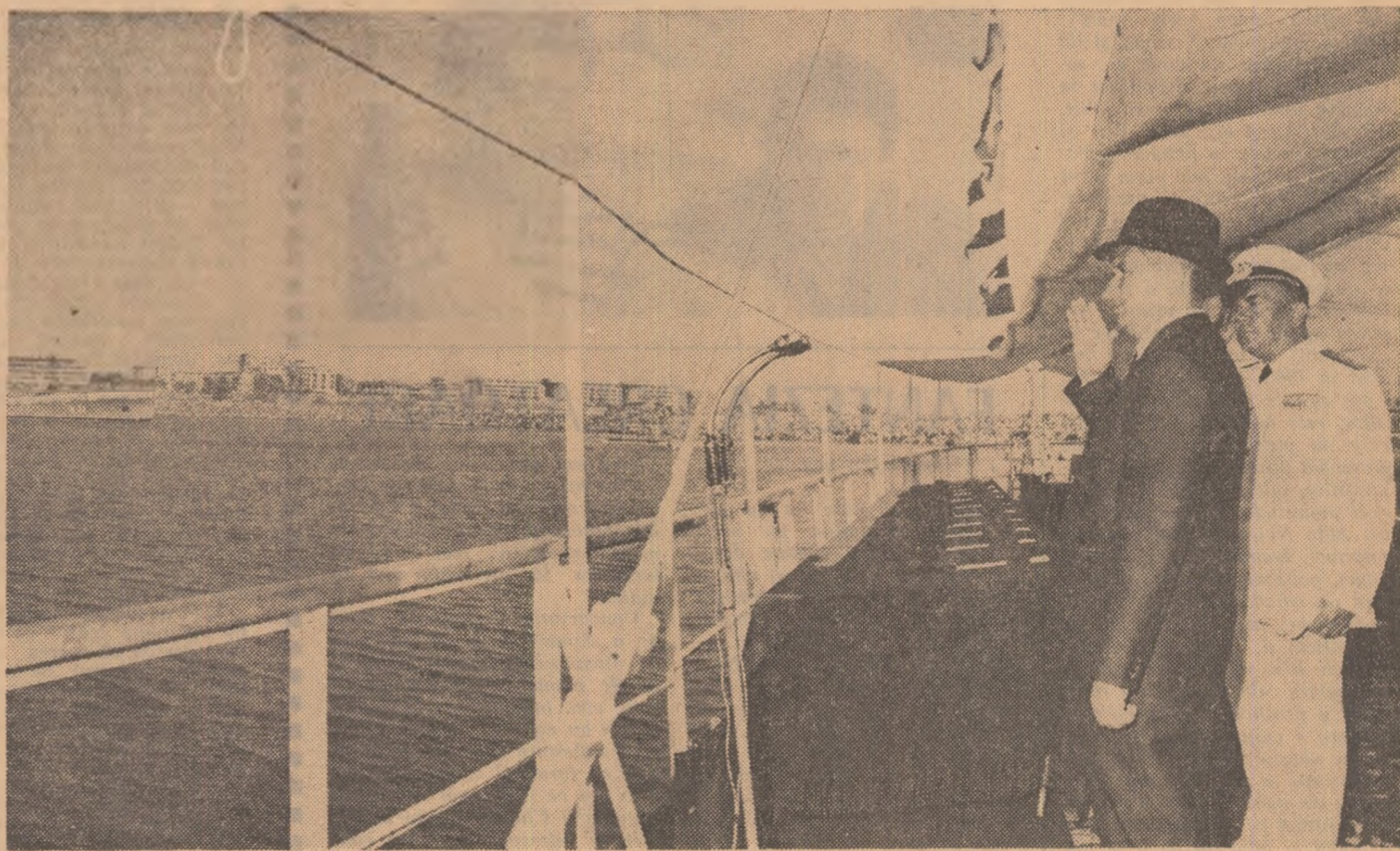
Tovarășul Nicolae Ceaușescu, comandantul suprem al Forțelor Armate adresează tuturor marin arilor felicitări.

Jalon între jaloanele noi din calendarul epocii socialiste a României, prima duminică din august consemnează sărbătoarea consacrată oamenilor mării. Zi-simbol, ca multe altele, moment în care poporul nostru aduce un fierbinte omagiu, închină sentimentele sale celor mai nobile de grație muncii fără preget a navigatorilor de pe vasele comerciale, a militarilor din forțele navale, a constructorilor de nave.