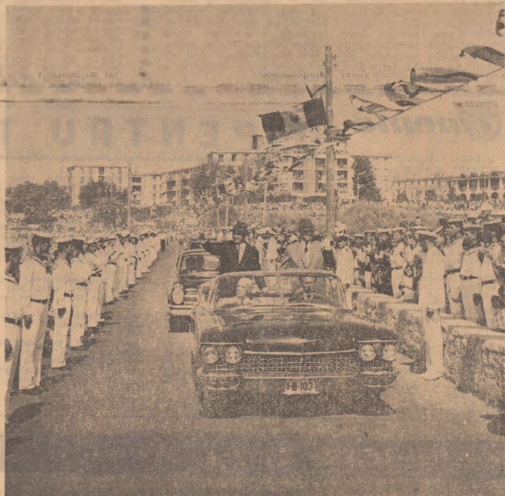
Marinarii, în elegantă ținută militară, fac o entuziastă primire conducătorilor de partid și de stat