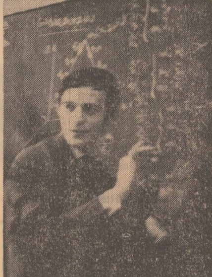
Examenele constituie pentru studenți un bun prilej de a demonstra calitatea pregătirii lor

A fi astăzi student înseamnă a-ți înțelege pînă în cele mai intime fibre ale sensibilității și pînă în cele mai adînci reverberații ale conștiinței menirea de viitor intelectual, constructor al societății socialiste. Și pentru că era pe care o trăim ne solicită pe toate planurile activității, ne cere răspunsuri imediate la problemele grave ale muncii de zi cu zi și la întrebările turburătoare care frămîntă omenească, ca reprezentanți ai unei societăți multilaterale dezvoltate, fiecare student este dator să se pregă-