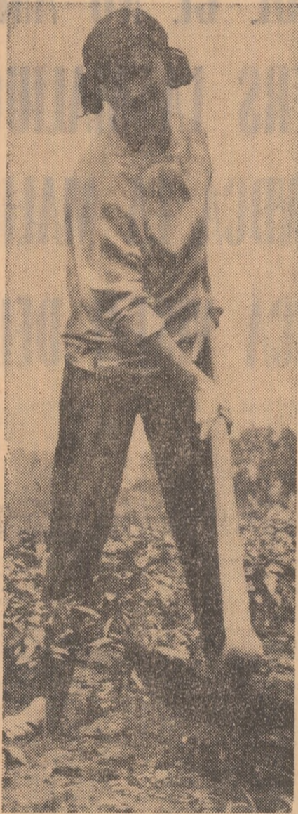
Studentii ai Institutului Agronomic din București, în timpul zilelor de practică