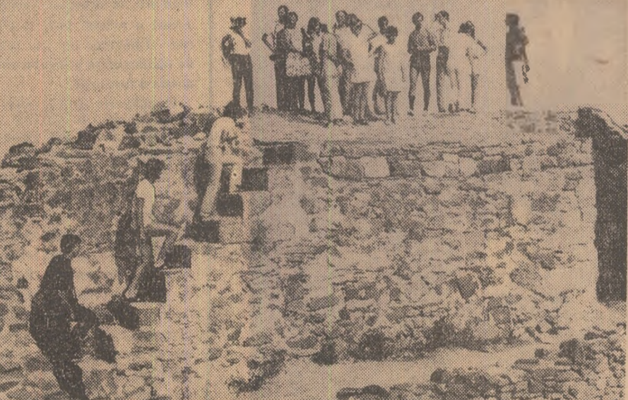
Excursiile sînt un bun prilej de aprofundare a cunoștințelor însușite în facultate. În imagine un grup de studenți în vizită în cetatea Istria.

tească pentru ziua de mîine multilateral și complex. Anul universitar încheiat, cel de al 26-lea de la eliberarea patriei, reprezintă pentru universitate un mare salt valoric în activitatea de instruire, de progres și de civilizație materială și spirituală. „DE ACEEA — spunea, de curînd, tovarășul Nicolae Ceaușescu în timpul vizitei de lucru efectuate în județul Timiș — DORESC SĂ ADRESEZ TINERETULUI DIN TIMIȘOARA, STUDENȚILOR, CALDE FELICITĂRI ȘI SĂ LE UREZ NOI ȘI NOI SUCESE, ÎNDEMNÎNDU-I SĂ MUNCEASCĂ CU RIVNĂ PENTRU A DEVENI BUNI CETĂȚENI AI PATRIEI. GATA ÎN ORICE MOMENT PENTRU LIBERTATEA ȘI ÎNALȚAREA ROMÂNIEI SOCIALISTE”. Și această apreciere devine o incununație majoră a întregului efort spre desăvîrșire profesională și etică, al studențimei noastre, în anul 1970, treapta cea mai înaltă a aspirațiilor și realizărilor de, pînă acum.