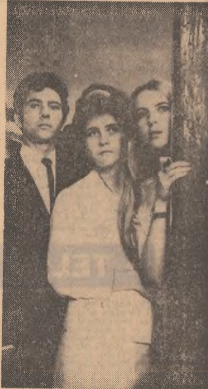
Oare unde com fi repartizați?

La primirea titlului de „doctor honoris causa” al Universității din București, Rene Maheu, directorul UNESCO, a declarat: Universitatea trebuie să se afle ancorată în cel mai acut prezent. Ea reprezintă un punct de vedere asupra universului!