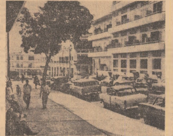
Imagine din Abidjan

Păduri imense, populate de elefanți, coastă pe alături mlăștinoasă. Acestea erau, în câteva cuvinte, însemnările din jurnalul de bord al primelor corăbii ce ancoraseră prin secolul al XV-lea, pe coasta occidentală a Africii, în apele golului Guineea, care mărginește azi-ași mai multe state independente. Mai tîrziu, o zonă a acestei regiuni africane a fost denumită Coasta de Fildeș — nume care reunea în întregul său nu numai prețioșii colți de elefant dar și frumoasele păduri de esențe rare. Secole de-a rîndul populația acestor meleaguri a fost supusă unei grele perioade de dominare colonială. Intensificarea luptei de eliberare, care a cuprins cea mai mare parte a Africii, s-a extins și asupra Coastei de Fildeș. Cu exploatarea un centru pentru extracția mineralelor de fier cu o mare concentrație în metal. Pentru anul următor se preconizează construirea unui al doilea mare centru economic (după Abidjan), în localitatea San Pedro. Orașul amintit va fi transformat într-un mare port al țării, prețioșii colți de elefant care în prezent aglomerează danele din zona capitală. În plus, se are în vedere extinderea zonelor de exploatare forestieră, situate în imediata apropiere a viitorului port, precum și viltorul unei căi ferate ce va lega exploatarea minieră de la San Pedro. Eforturi deosebite se întreprind și în domeniul producției energiei electrice. Pe fluviul Bandama, în impre-