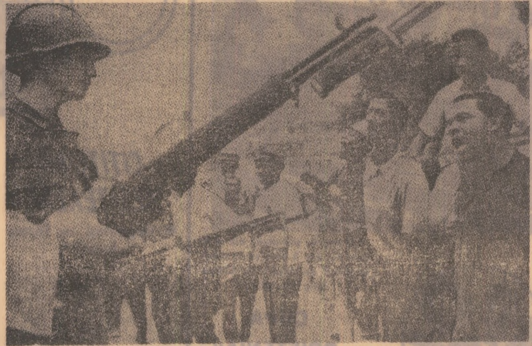
S. U. A. — Aspect din timpul recentelor incidente rasiale din orașul Newark

Încheierea, șeful delegației române a relevat datoria Comitetului pentru dezarmare ca, prin eforturile tuturor membrilor săi, să alcătuiască programul deceniului solicitat de Adunarea Generală a O.N.U., pentru a-l supune spre dezbateri și definitivare celei de-a XXV-a sesiuni a acesteia. După cuvântarea reprezentantului român, delegații Iugoslaviei, Canadei, Cehoslovaciei și Japoniei au prezentat Comitetului cite un document de lucru privind eventuala interzicere a producției și utilizării armelor chimice și bacteriologice.