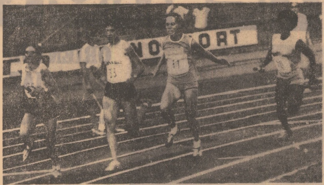
Finis într-una din probele de alergări.

La invitația Uniunii Scriitorilor, a sosit în țara noastră scriitorul sovietic Oles Goncar, secretar al Uniunii Scriitorilor din R.S.S. Ucraineană. În timpul șederii în România, oaspetele sovietic se va întâlni cu scriitorii români și va vizita instituții de cultură.