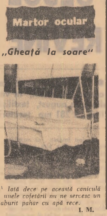
Întă de ce pe această caniculă unele cofetării nu se servesc un aburț pahar cu apă rece.

I. DANŢEA Martor ocular „Gheață la soare”