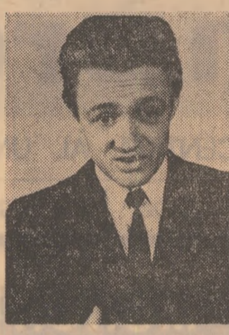
Tînărul actor DAMIAN DAMIŃSKI, în rolul principal al filmului „Noul angajat“

Przec de la atelierul unei stațiuni de mașini agricole, unde „se cîștigă puțin și nici nu erau piese de schimb“, eroul găsește imediat, într-o uzină din Varșovia, un post de strungar. Din acest moment începe marea aventură a luptei cu certificatele și adeverințele. În primul rînd imense așteptare de pe culorale unei policlinici (bineînțelese, pentru certificatul medical), apoi, pînă cînd ajunge — îmbrăcat în salopetă — în fața strungului, nesfîrșite drumuri la fel de fel de ghișee și uși: vechitul loc de muncă (pentru o referință), la serviciul de protecția muncii și la „spațiul contra incendiilor“ (pentru instrucția), la... Secvențele filmului au un umor care vine de la prezentarea dezinteresului, a plictisului și a oamenilor din „spatele“ diverselor uși și ghișee întimpînd pe tânărul solicitant. Filmul nu are comicul gros, rustic, cu care ne-au obișnuit prezentarea unor subiecte asemănătoare. Cînd nu înfîșează funcționarii aflați în pauza de muncă ori la o suțetă pe teme cotidiene, eroul înfîșează binevoitorii care