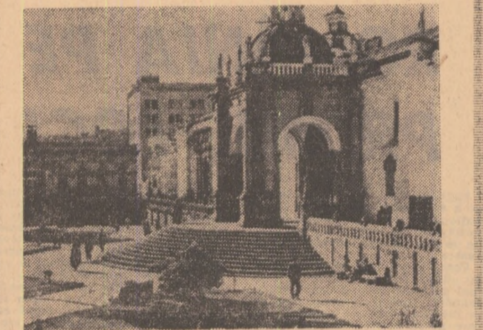
Imagine din Quito — capitala Ecuadorului

tru actualitatea ecuadoriană, nu sînt nici tonele de mărturie care tranzitează prin Guayaquil și nici blocurile din beton, oțel și sticlă apărute în ultimii ani la periferia capitalei Quito. Un alt domeniu, răsărit acolo unde se aștepta cel mai puțin, captează în prezent atenția ecuadorienilor: petrolul! Este una din speranțele de care se leagă proiectele de dezvoltare economică. Descoperit într-o zonă în care elementele progresului s-au făcut cel mai puțin simțite, undeva la est de Anzi, în bazinul amazonian, petrolul a început deja să fie exploatat la mai multe sonde, fiecare din ele cu o productivitate zilnică evaluată la cîteva mii de barili. Cercetările geologice au evidențiat existența unor zăcăminturi potențiale de circa 303 milioane de barili de țit, alcătuit, potrivit unor surse, cel mai substanțial strat petrolifer din America Latină. În acest context, problema revizuirii legislației privind concesi-