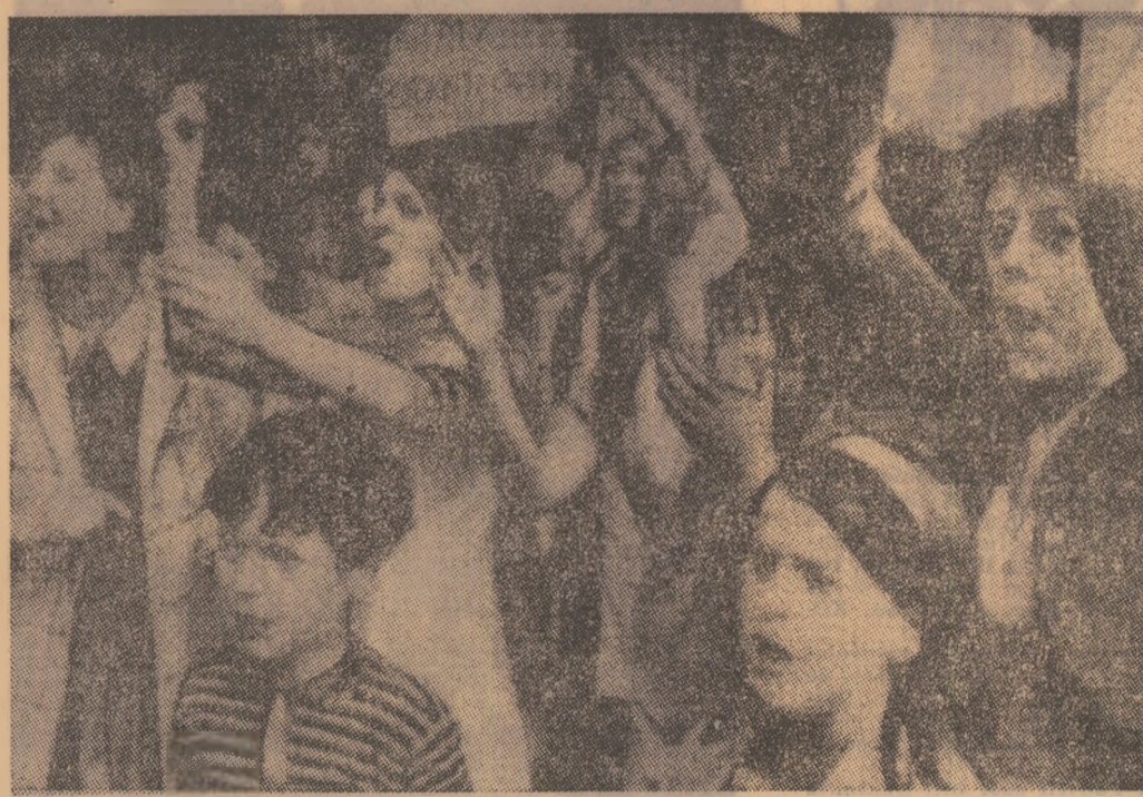
IRLANDA DE NORD: Femei dintr-unul din cartierele cu populație predominant catolică ale Belfastului protestînd împotriva brutalității intervențiilor soldaților britanici

După cum transmisiunile agenției de presă auorii răpirii n-au renunțat la intenția de a executa pe cei doi ostacii dacă guvernul nu va fi de acord să elibereze în schimb lor pe toți membrii organizației clandestine, aflați sub stare de arest. Se pare că autorii răpirii speră într-o schimbare a atitudinii guvernului supus unor puternice presiuni exercitate îndeosebi de Brazilia, pentru asigurarea eliberării consulului Gomide.