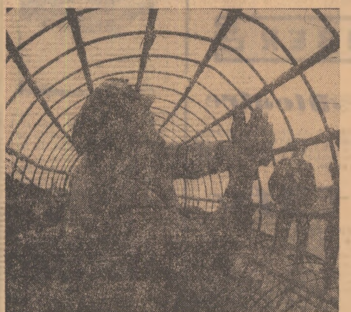
Secvență fotografică de pe Șantierul național al tineretului de la Rogojelu