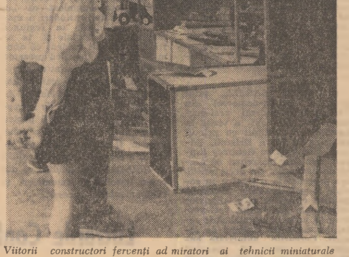
Vizitii constructori feroveni admiratori ai tehnicii miniaturale

Înalta distincție care a fost acordată revistei „Lupta de clasă”, aprecierile pe care le-ați rostit cu acest prilej, indicațiile privind munca de viitor, constituie pentru noi, ca și pentru întreaga presă, un imbold și un prețios sprijin în perfecționarea activității teoretice și publicistice.