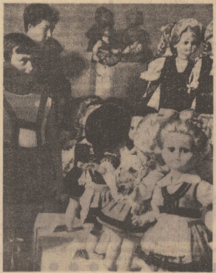
Aspect din expoziția de costume populare miniaturale realizate de cititorii revistei „Johardt”, deschisă duminică în sala Casei de cultură Petoși Sandor. Expoziția poate fi vizitată zilnic între orele 9—13 și 16—20.