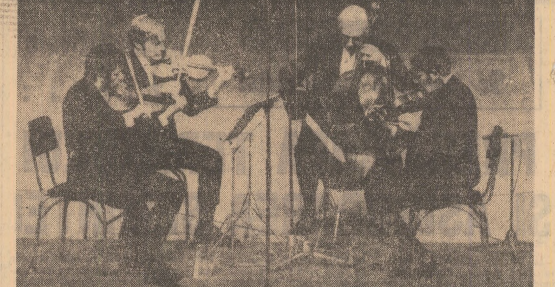
Cartetul „Juilliard”