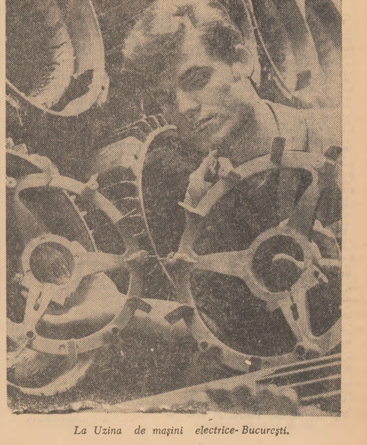
La Uzina de mașini electrice-București.

INDUSTRIA ORAȘULUI FAGĂRAȘ a realizat prevederile planului cincinal la producția globală. Față de anul 1965, industria FAGĂRAȘULUI a marcat o creștere de 72 la sută. Un procent de 80 la sută din sporul de producție a fost obținut pe seama creșterii productivității muncii. Cele mai bune rezultate au fost obținute de Combinatul chimic, care a îndeplinit planul cincinal la îngrășăminte în numai patru ani și opt luni. Pe întreaga industrie a orașului se prevede realizarea unei producții suplimentare în valoare de 340 milioane lei. INTREPRINDEREA MI-NIERA DIN DOBREȘTI, principala furnizore de materii prime a Uzinei de aluminiu din Oradea, este cea de-a 20-a unitate industrială din județul Bihor care și-a realizat, la începutul acestei săptămîni, sarcinile planului cincinal. Potrivit calculului, pînă la sfîrșitul anului întreprinderea va livra peste sarcinile de plan circa 108.000 tone bauxită concasată. Succesul amintit se datorește faptului că productivitatea muncii a crescut în acest timp cu 21,4 la sută. (Agerpres)