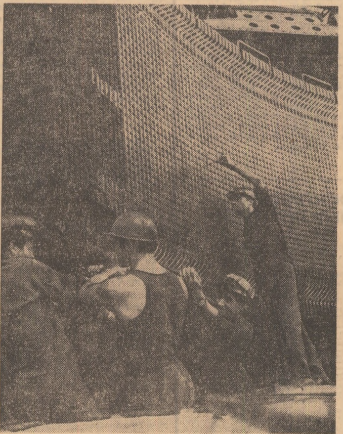
Porțile de Fier: se lucrează la montarea grupului energetic nr. 4 cu utilaj în întregime fabricat în România.

Iată, sărbătorim la anul o jumătate de veac de la întemeierea Partidului și cu toții așteptăm — cit de îndrăgățit! — această strălucită împlinire a creației noastre literare românești: ca opera de referință existențială pentru clasa muncitoare, pentru insul român ajuns la nivelul contemporan al conștiinței sale revoluționare, în sensul doctrinei și practicii Partidului nostru. Multiple sînt semnele că ea s-ar putea ivi. Ar fi — în ordinea istorică a procesului de creație literară românească — cea mai actuală și totodată cea mai investită sub semnul parenității.