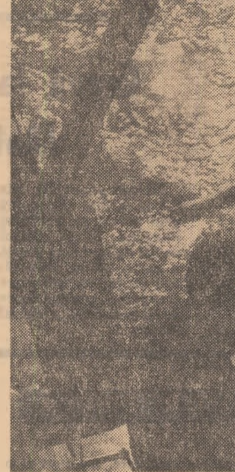
Excursioniști în Delta Dunării