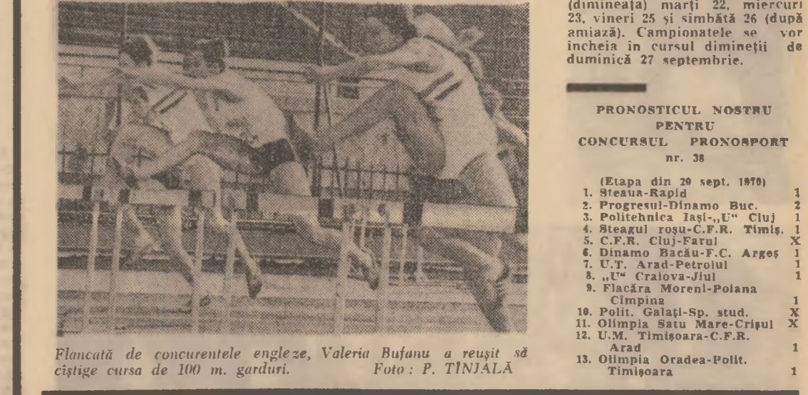
Flanță de concurențele engleze, Valeria Bufanu a reușit să câștige cursa de 100 m. garduri.

Concursurile continuă în zî- lele de duminică 20 septembrie (dimeinea) marți 22, miercuri 23, vineri 25 și sîmbătă 26 (după amiază). Campionatele se vor încheia în cursul dimineții de duminică 27 septembrie.