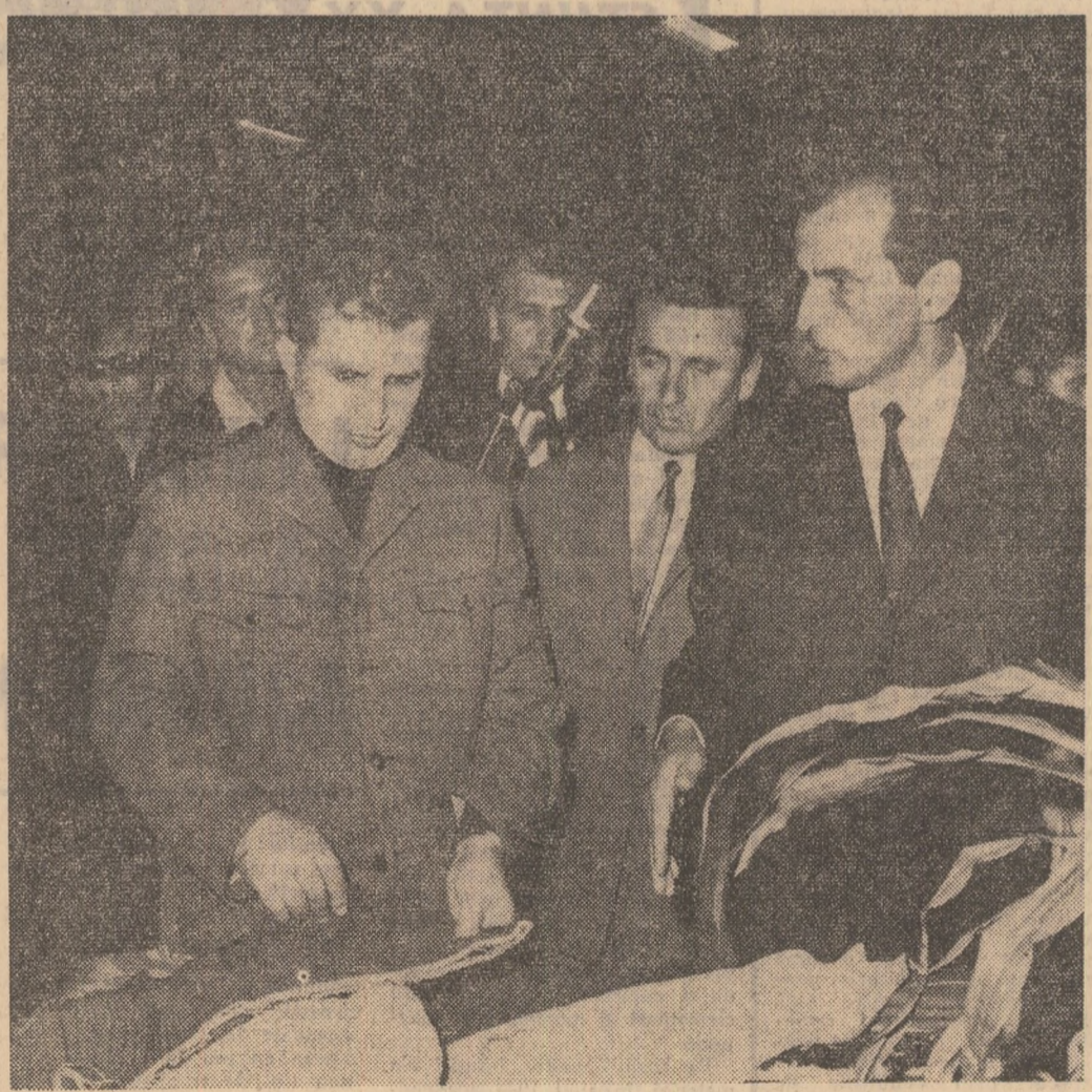
În incinta întreprinderii „Metalotehnica” din Tg. Mureș