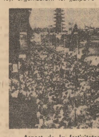
Aspect de la festivitatea de închidere a „Expo 70”.

Vrînd-nevrînd, „Expo 70” a apărut și ca un test de adaptabilitate: din înregistrarea a 48.190 copii pierduți și 127.457 persoane adulte rătăcite s-a tras concluzia că cei în vîrstă s-ar descurca mai greu în mari aglomerații. Chiar dacă această apreciere apare pripită, totuși organizatorii lui „Expo 70”