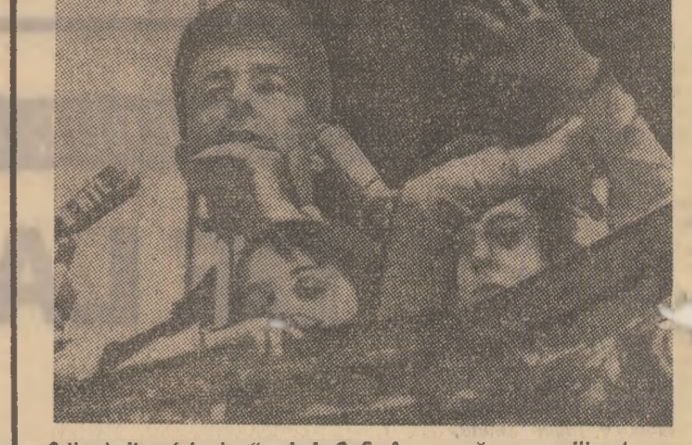
Stil „à l'américaine” — J.-J. S.-S. împreună cu copiii, la o adunare electorală.

Servan-Schreiber este deputat de Nancy. Legea îi îngăduie, însă, să-și prezinte candidatura și într-o altă circumscripție, urmînd ca în eventualitatea alegeții să opteze pentru unul din mandate. J.-J. S.-S. nu are intenția, s-ar părea, să întoarcă spatele alegătorilor de la Nancy. Prezența sa la Bordeaux este doar a sfidare adusă candidatului guvernamental — premierul Chaban Delmas. Temutul polemist parizian speră să pună în dificultate pe șeful guvernului și să-l oblige să părăsească funcția pe care o deține. Tentativa este riscantă, vizează chiar imposibilul, deoarece Chaban Delmas se află pe un „teren