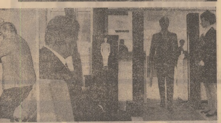
Pe aeroporturile internaționale, în urma ultimei serii de deturări de avioane, s-au intensificat controalele și măsurile de securitate. Imaginile de mai sus au fost luate la Amsterdam și la Londra.