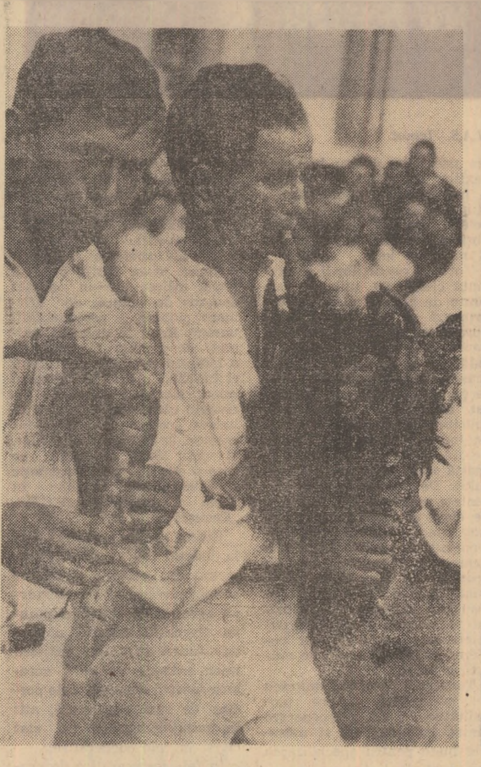
Cîmpoieri din Vrancea.