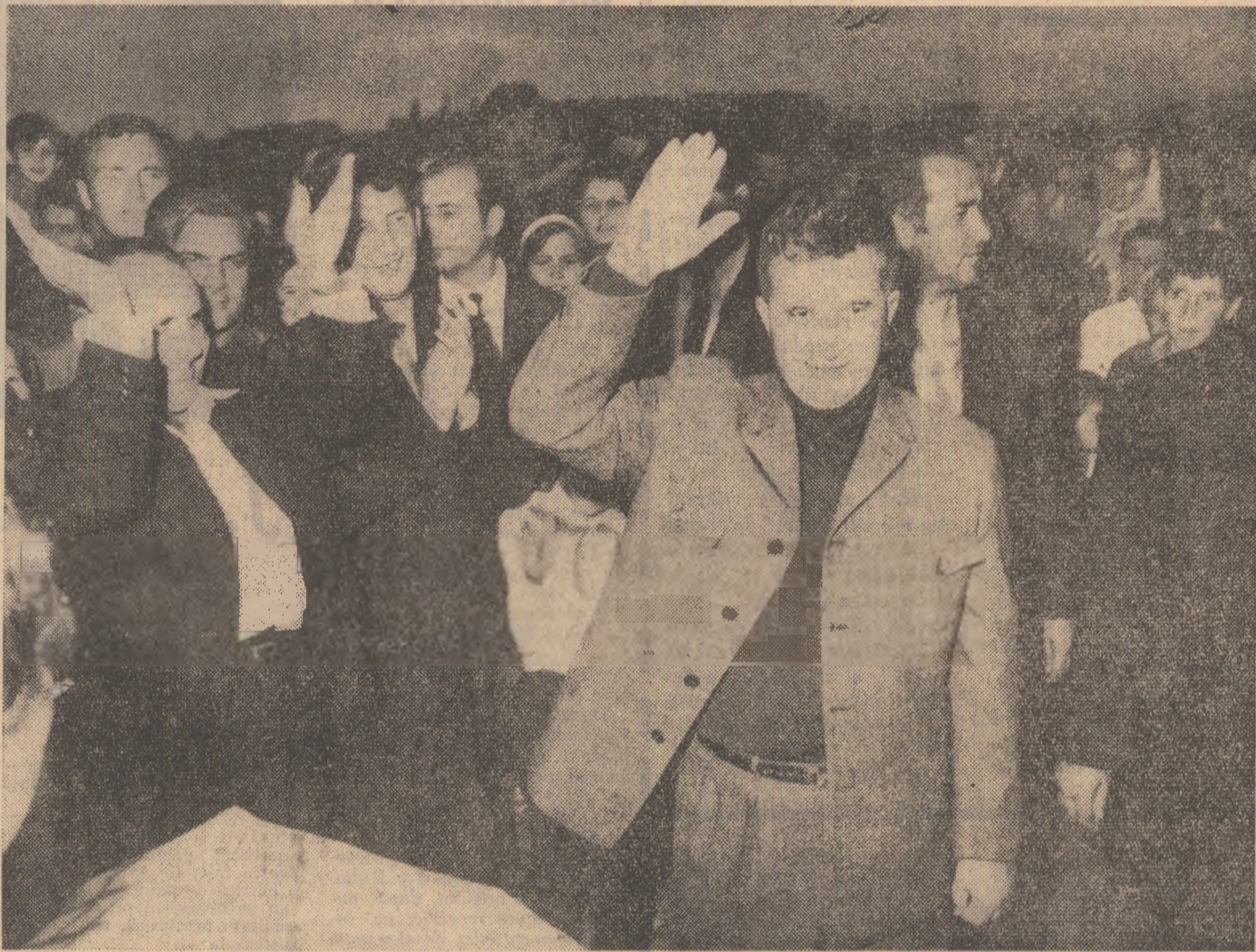
În timpul vizitei I.A.S. Iernut

Tovarășul Ceaușescu apreciază eforturile depuse de specialiștii, eficiența onora dintre soluțiile adoptate și recomandă ca în extinderea întreprinderii de felul celor de la Iernut să se aibă în vedere realizarea treptată a construcțiilor în funcție de posibilitățile materiale și financiare. De ase-