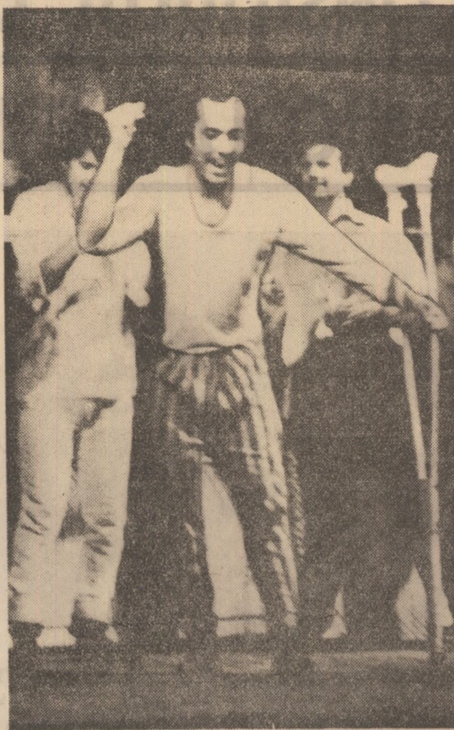
Aspect de la una dintre repetițiile cu piesa „Comoara din insula piraților“, a cărei premieră a avut loc, de curînd, la Teatrul de copii și tineret „Ion Creangă“