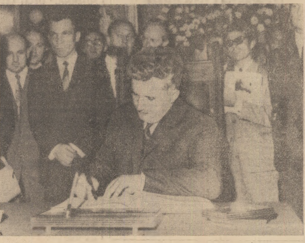
Tovarășul Nicolae Ceaușescu semnînd în Cartea de aur a primăriei din Viena.

Intr-un fel, constructorul — Truștii I București — are dreptate. Raționamentul său este simplu. Deci — își spune — la ce obiective trebuie să asigur intrarea în funcțiune la sfîrșitul trimestrului III? La x, la y, la z. Bun. Cum stau acolo, cu lucrările? Nu prea grozav. Dacă țin să-mi respect cuvîntul trebuie să suplimentez forța de muncă în punctele al căror stadiu, față de grafice, este rămas în urmă. Perfect. Voi transfera deci un număr de muncitori de la „Eletromagnetica” — instalația de neutralizarea apelor reziduale, depozitul de inflamabile, extinderea turnătoriei de magneți — trebuie predate de abia în cursul trimestrului IV, pînă la 31 decembrie — la Fabrica de prefabricate din beton „Progresul”. Zis și făcut. Rocada a avut loc. Ce năzare are despre ea beneficiarul? — Sincer să fiu — își exprimă opinia tov. ing. Vasile Uzineț, director tehnic al Uzinei „Eletromagnetica” — sînt îngrijorător. În anul următor sarcinile de plan ale întreprinderii cresc. Cînd s-a făcut fundamentarea lor, s-au avut în vedere și capacitățile de producție ale obiectivelor despre care omîntiți. GH. GHIDRIGAN (Continuare în pag. a V-a)