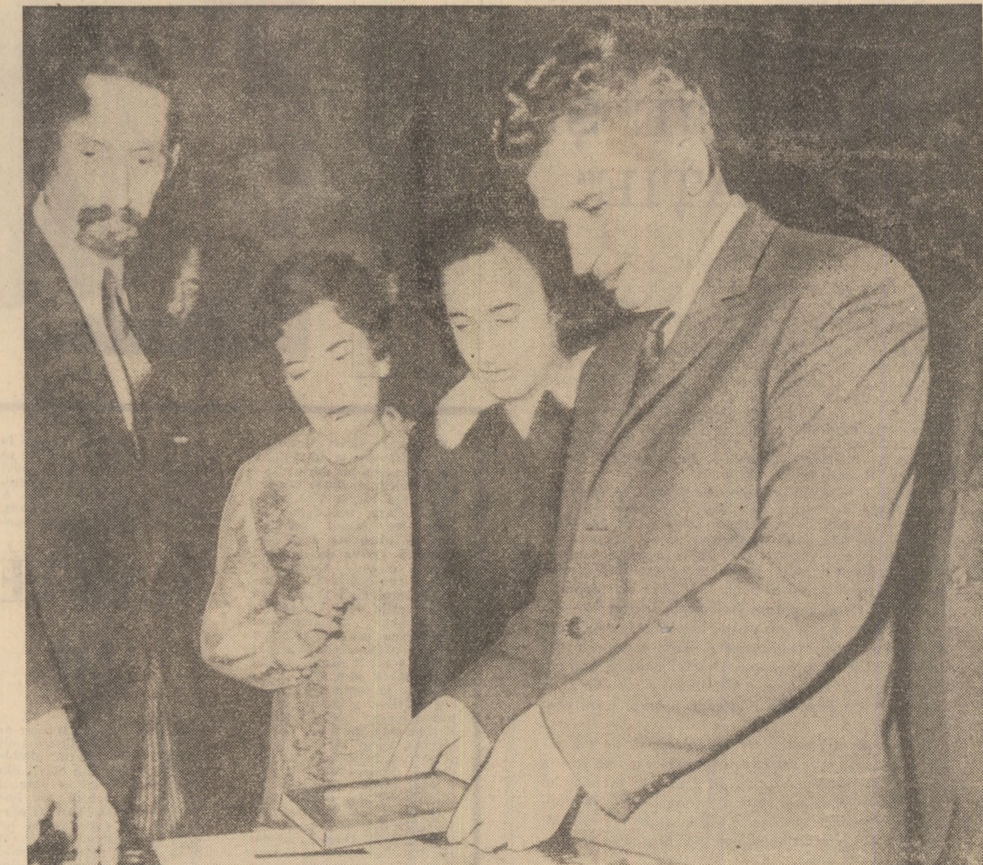
În vizită la Muzeul de istoria artelor

La intrarea în muzeu, președintele Nicolae Ceaușescu și soția sa, Elena Ceaușescu, sînt