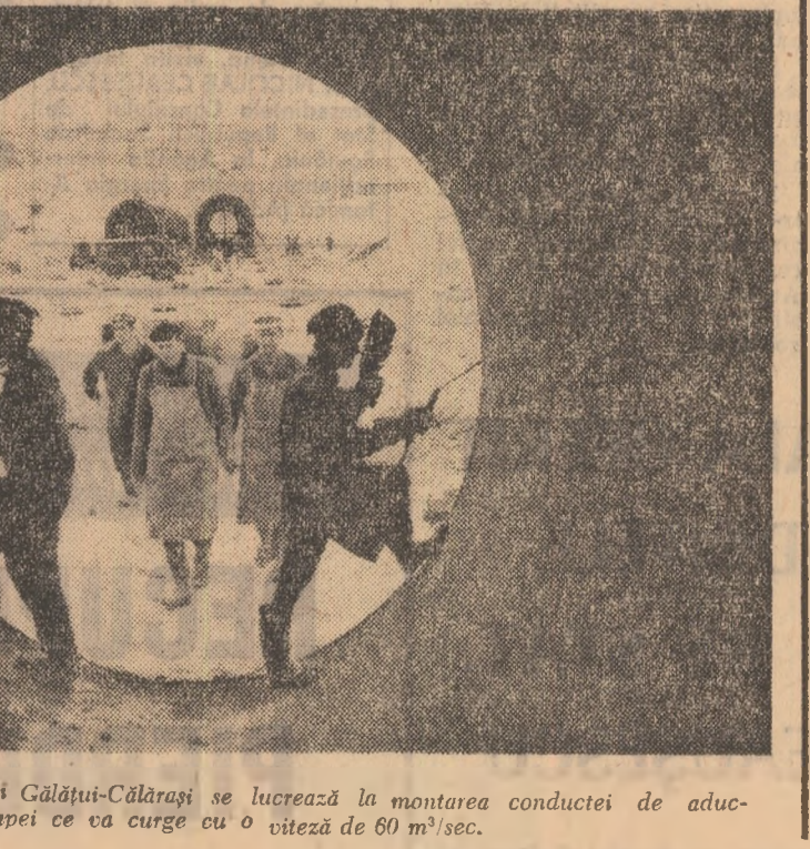
Pe șantierul sistemului de irigații Gălbăni-Căldărași se lucrează la montarea conductei de aduc- țune a apei ce va curge cu o viteză de 60 m/sec.