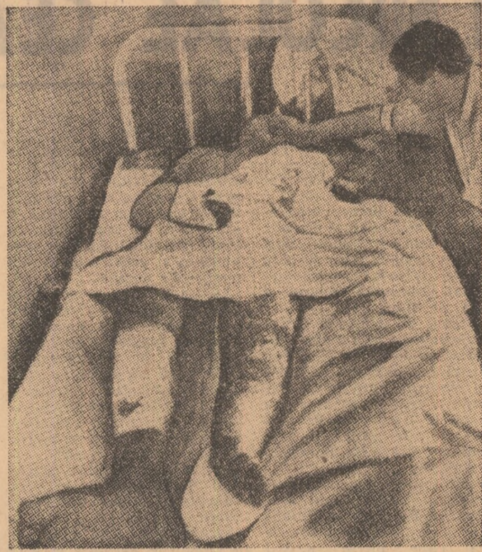
Într-un spital din Amman în aceste zile: o victimă a singurorului lupte.