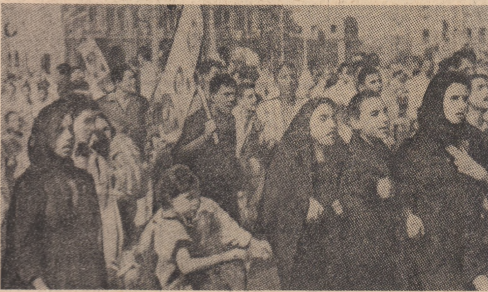
R. A. U. — Încă în prezua funeraliilor președintelui Gamal Abdel Nasser sute de mii de cetățeni veniți din toate colțurile țării s-au adunat la locurile Capitalei pentru a-i aduce președintelui decedat ultimul lor omagiu