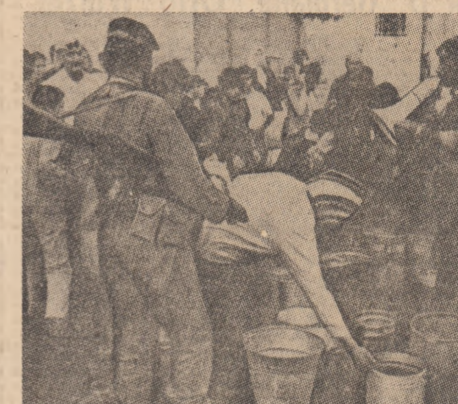
IORDANIA. — În urma acordului intervenit între guvern și organizațiile palestinienilor, la Amman viața începe să revină în normal. În fotografie, populația aprovizionându-se cu apă după încetarea luptelor