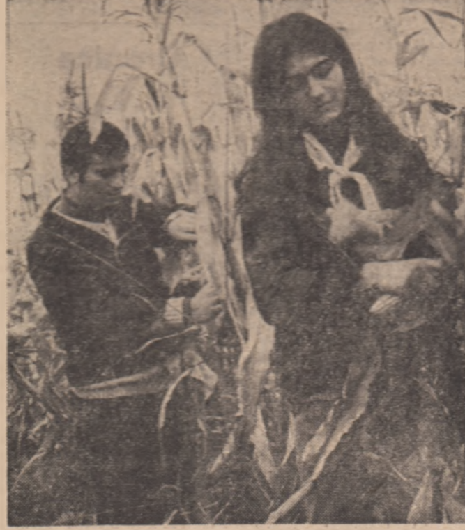
Ieri, aproximativ zece mii de tineri din București au lucrat la strânsul recoltei...