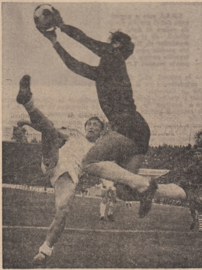
Fază din întâlnirea Progresul-F.C. Argeș.

Sînt în dulce tîrgul leșilor. O și de toamnă cum de foarte mulți ani nu mi-a fost dat să irăiesc. Aici unde lumina se întîlneste cu bucuria, unde lumea cîntă pe struguri, unde copacii ard frumos, aici unde amurgurile ne dor pe toți, aducîndu-ne aminte că toți am fost pămînt și copii, aici la Iași toamna cîntă frumos. Iată-mă în ziua de duminică pe strada Lăpușeanu, unde Mihail Sadoveanu cîntă adînc și somnoros, iată-mă aici pe o stradă rebelă și frumoasă, pe o stradă unde se dansează cu frunzele și se discută despre fotbal. La Iași, în aceste zile are loc Festivalul „Eminescu”, la Copou și la Școlăuța lui Creangă, poezii României recită din marele Eminescu. La Iași, frumoasă a nuc, a coro și tîrzoare. La Iași, în dimineața de duminică toată lumea discută despre șansele Politehnicii. Sînt singurul care nu am acordat