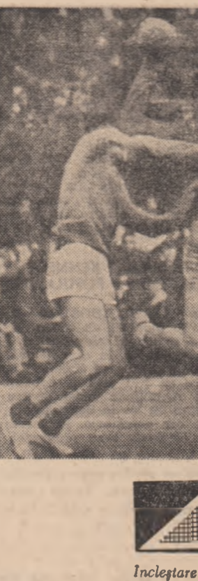
Înclețare pe semicerc