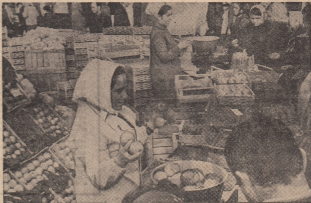
Imaginea des înflăcărată în piețe