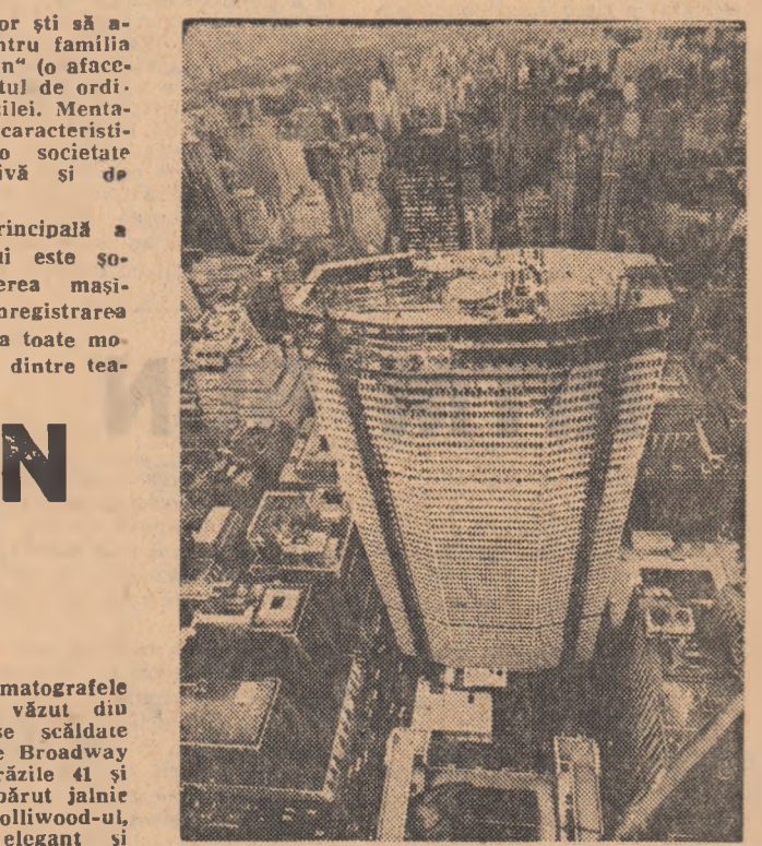
Imagine din New York.

rinde 40 de procente din comerțul întregii națiuni. Prin el se scurge o parte din mărurile și bunurile produse de industria internă a orașului. Industria de confecții cu cele 300 de ramuri, tipografiile Gotham care tipăresc aproape trei pătrimi din toate cărțile americane, cuvinatul zilei, 55 de mii de unități factoriale și uzinale, 70 la sută din agențiile comerciale americane întregesc un tablou de expansiune industrială ale cărei semne