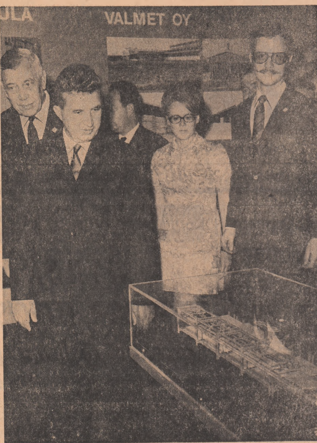
Vizitînd unul dintre standurile țărilor care participă la Tîrgul internațional de la București.

Tovarășul Nicolae Ceaușescu, ceilalți conducători de partid și de stat, membrii delegațiilor guvernamentale de peste hotare iau apoi loc la tribuna oficială, amenajată în fața pavilionului central.