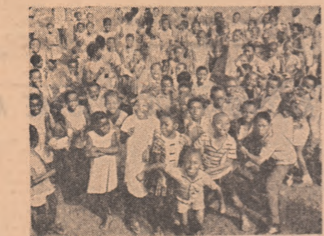
Într-o școală africană.

gradul II? Efectivele școlilor de acest nivel — relatează tot JEUNE AFRIQUE — reprezintă doar 8,6 la sută din numărul elevilor școlare primare (de altfel, nici procentul de a atinge 10,4 la sută n-a fost îndeplinit). Școala medie are în Africa conținutul extrem de restrîns. Doar un procentaj infim de copii africani reușesc să-și treacă pragul. Este, în fond, o elită recrutată de obicei din mediul urban. La acest capitol se mai adaugă o problemă: mulți din școlarii care ocazional de un profund dramatism. Pentru toate statele africane, cu toate greșelile realizate, problema învățămîntului reprezintă, însă, un dosar nereșolvat. Experiența consideră necesară găsierea unor modalități potrivite mediului african care să îngăduie o școlarizare pe scară largă și cu cheltuieli reduse. Televizorul-profesor îi aparține viitorului! Poate. Dar, oricum, nu este vorba numai de înestrări tehnice.